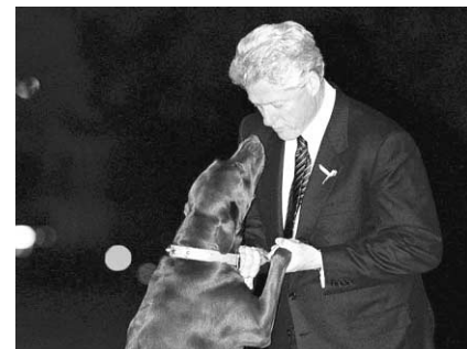
Bill Clinton et son chien Buddy.

La police, qui a disculpé l'automobiliste, n'a su dire si le chien était en promenade lors de l'accident ou s'il s'était échappé de la maison. « Buddy a simplement bondi devant une voiture », a précisé le policier Larry Green. L'incident a eu lieu sur la route 117, très fréquentée, qui passe devant la rue