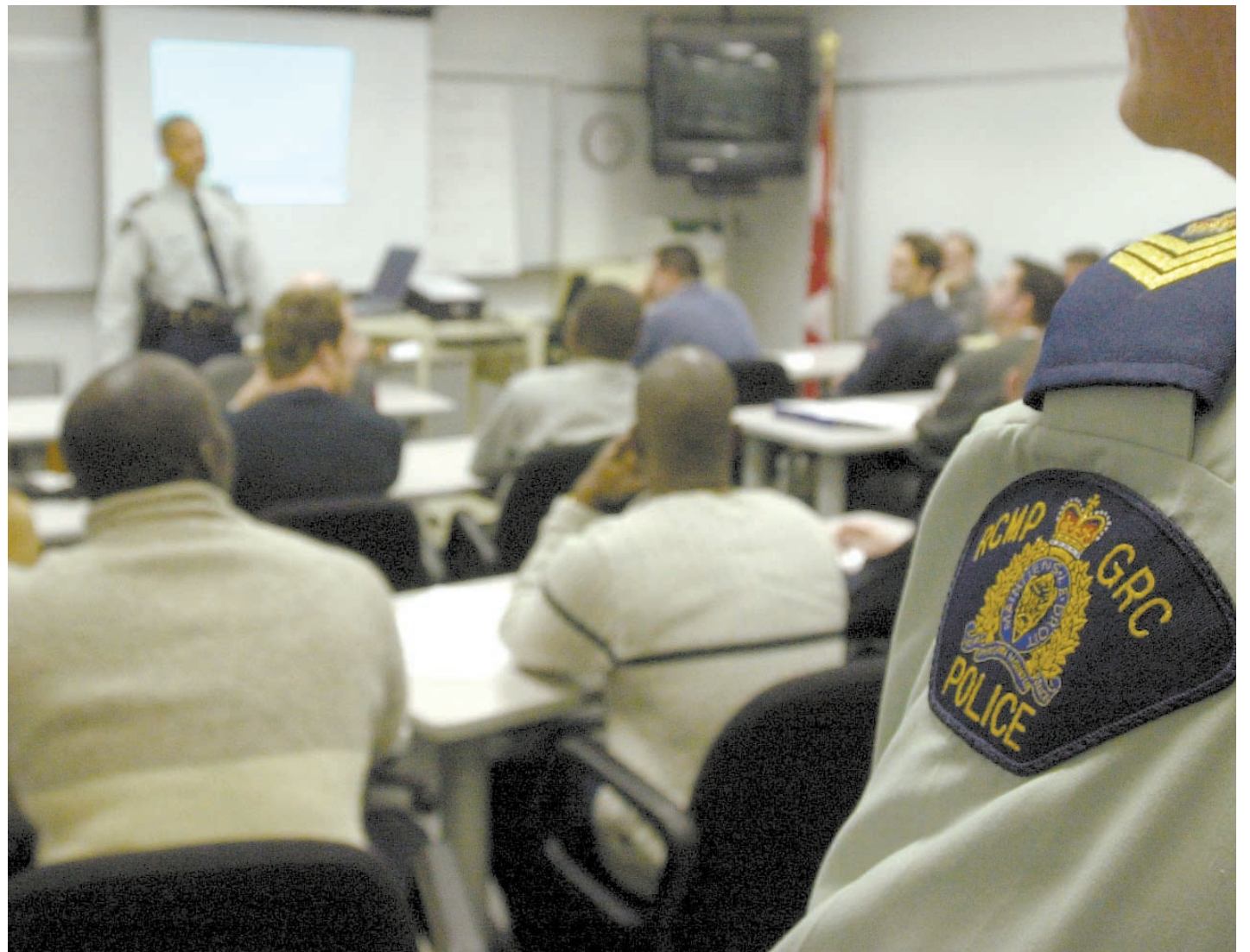
Les sessions d'information pour une carrière dans la GRC sont de plus en plus populaires.