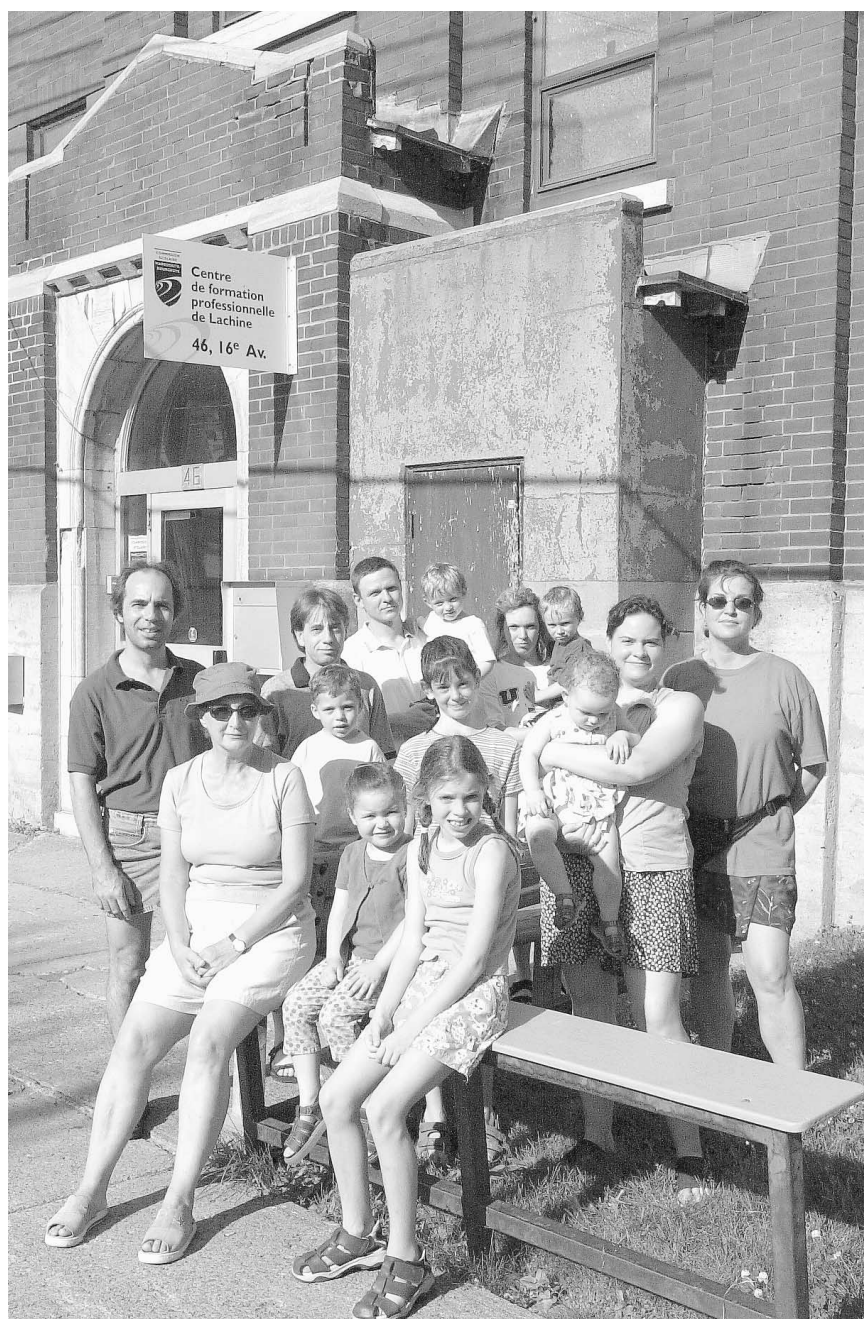
Des citoyens de Lachine sont inquiets depuis que des particules de fibre de verre se sont échappées d'une des cheminées d'un centre de formation professionnelle situé dans un quartier résidentiel.

De son côté, Chantal Gagnon, porte-parole de la Ville de Montréal en matière environnementale, affirme qu'un inspecteur de la Ville s'est rendu sur les lieux. Il a constaté que la commission scolaire avait omis de demander un permis pour la cheminée d'où s'est échappée la fibre de verre. La commission scolaire a jusqu'au 31 août pour en faire la demande, ce qu'elle compte faire. Dans la foulée, les autorités montréalaises s'assureront de la conformité aux normes de cette cheminée et de l'épurateur qui y est installé.