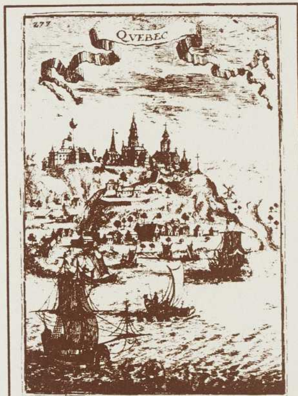
Bibliothèque Nationale du Québec