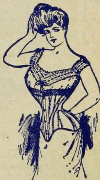
MODELES LES PLUS NOUVEAUX.

Les Dames qui insistent pour avoir les Crompton ne le regrettent jamais.