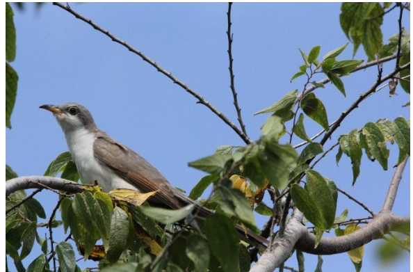
Coulicou à bec jaune en Floride