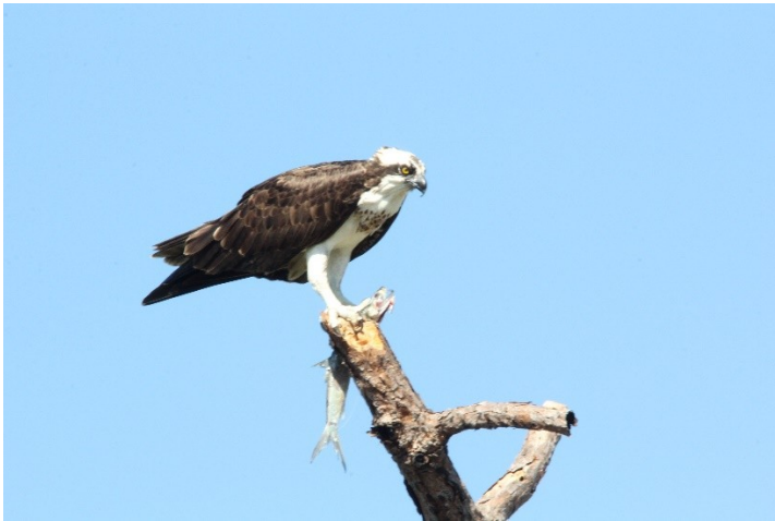
Balbusard en Floride