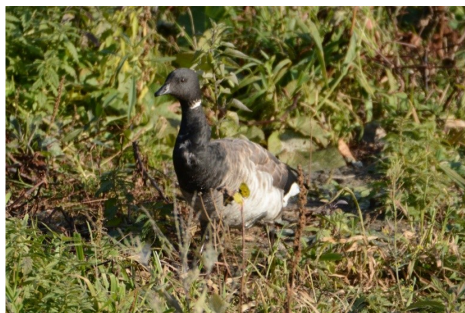
Mais, l'imprudente a quitté le milieu aquatique pour s'aventurer sur la pelouse