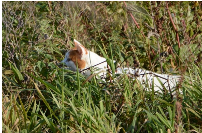
Chat domestique à l'affût

Combien d'oiseaux sont tués par les chats par année? Quelle est la première cause de décès?