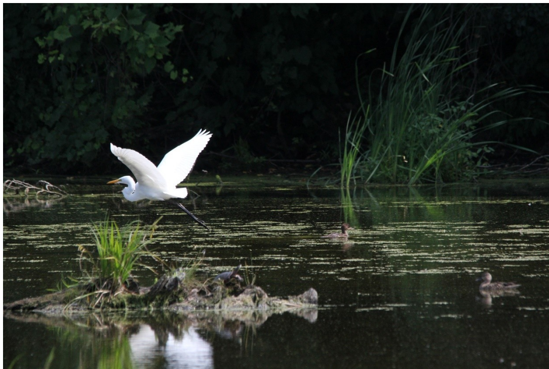
Grande Aigrette au marais de Lise