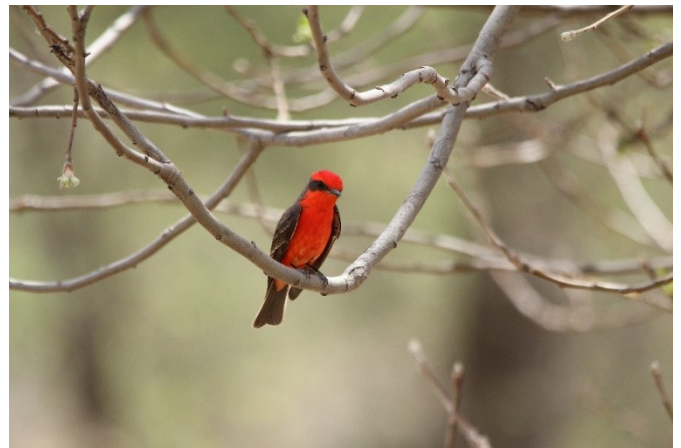
Moucherolle vermillon en Arizona

Je l'observe et j'aime voir ses beaux yeux indigo se mettre à briller, son sourire écarlate et son excitation nonpareil et ça me réjouit. Sans qu'elle le sache, à ces moments là, je constate que la fébrilité est contagieuse et les papillons reviennent me chatouiller l'estomac. La voilà maintenant en train d'inviter ses amies à joindre sa passion et à leur présenter ses nouveaux amis aviaires. Bravo ma sœur, les oiseaux te vont bien.