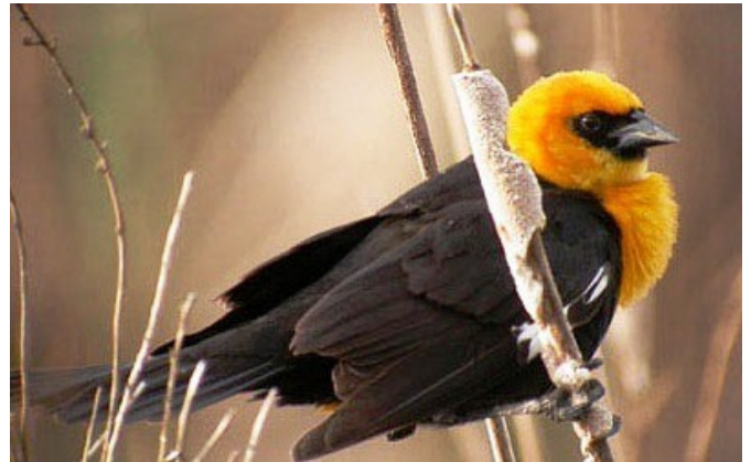
Carouge à tête jaune en Arizona

En Arizona, c'est encore ma sœur qui nous a déniché le Carouge à tête jaune et le Moucherolle vermillon pourtant bien caché.