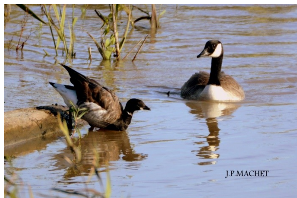
Accompagnée d'une Bernache du Canada