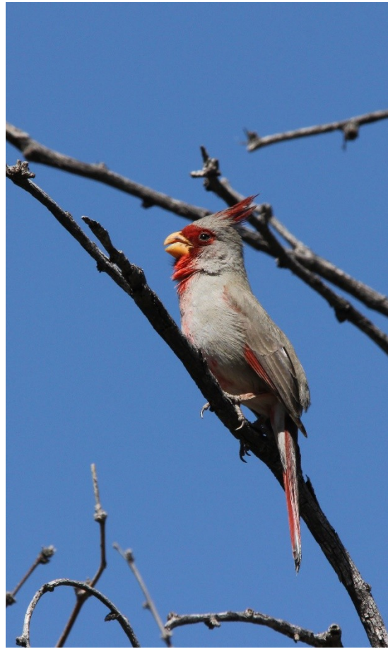
Cardinal pyrrhuloxia en Arizona