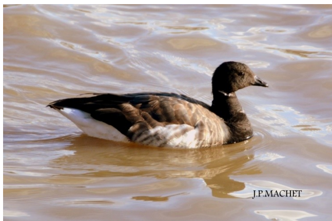
Une Bernache cravant se prélassait sur la rivière des mille-îles