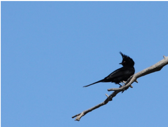
Phénopèle en Arizona