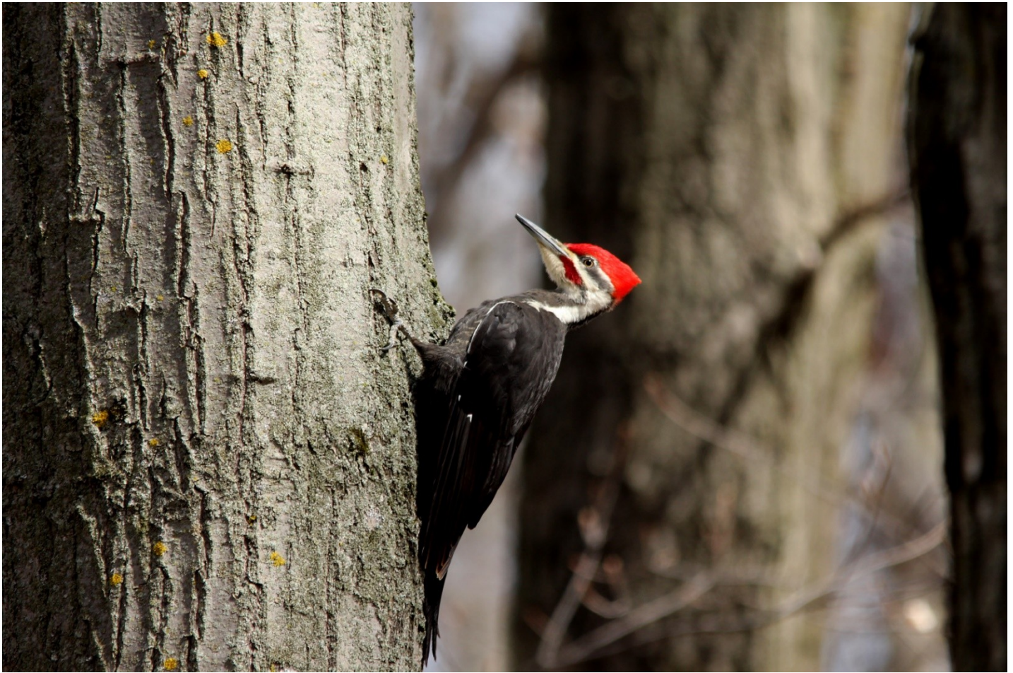
Grand Pic mâle (à cause de la moustache rouge)