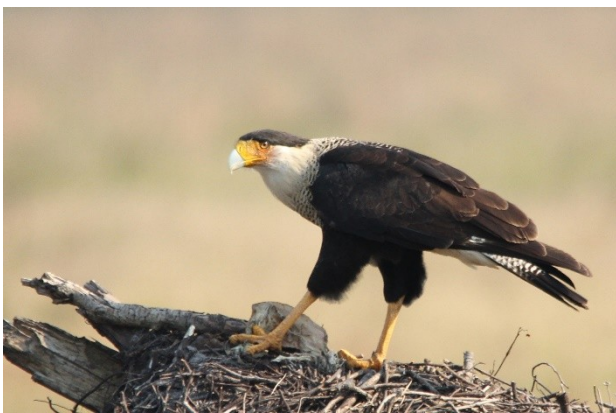
Caracara du nord en Floride