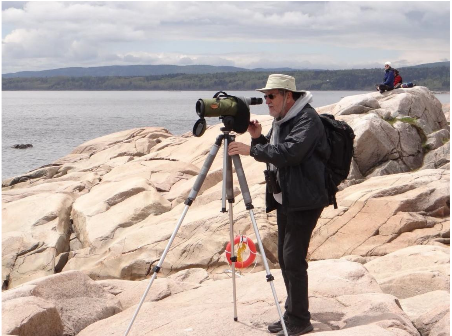
À Cap Bon désir, mai 2017, excursion annuelle du Cordem