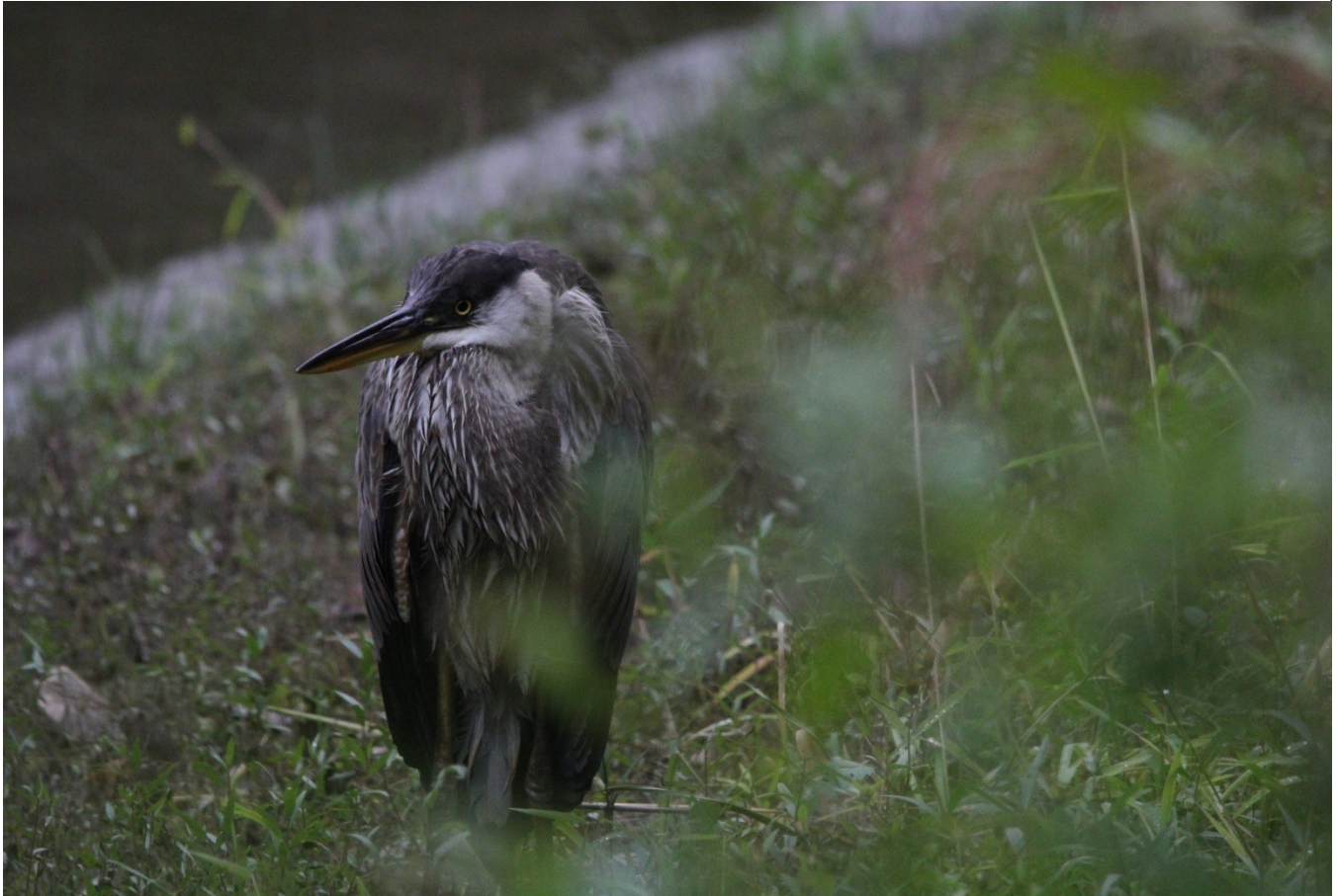
Grand Héron à l'île de la Commune de Berthier