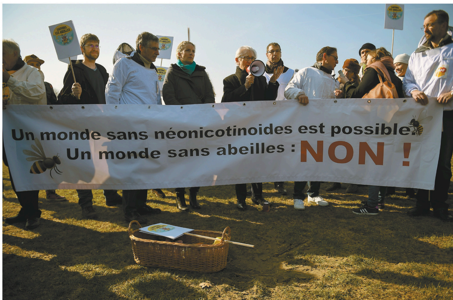
La lutte contre les pesticides néonicotinoïdes fait rage dans plusieurs pays. En France, les manifestations ont mené à un bannissement complet à compter de 2020.