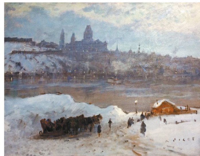
Robert W. Pilot « Vue de Québec au crépuscule, depuis Lévis » Huile sur toile, v.1935, 22" x 28"