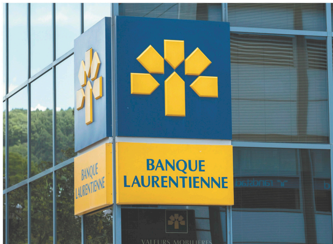
La section locale 434 du Syndicat des employés professionnels et de bureau (SEPB, affilié à la FTQ) est déjà présente au sein des établissements de la Banque Laurentienne du Québec.

Finalement, après les premières vérifications, le CCRI a statué que le requérant semblait détenir suffisamment d'appuis à sa demande de révocation pour qu'il ordonne la tenue d'un vote, afin de vérifier la volonté des syndiqués. Mais comme le syndicat a déjà déposé une plainte de