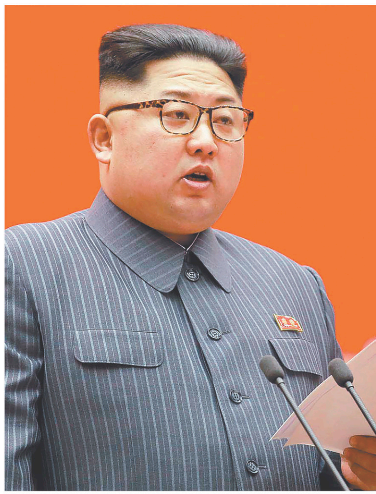
Le Conseil en est à son neuvième train de sanctions onusiennes contre le régime nord-coréen du leader Kim Jong-un.

Par ailleurs, le texte soumis au Conseil limite les livrai-