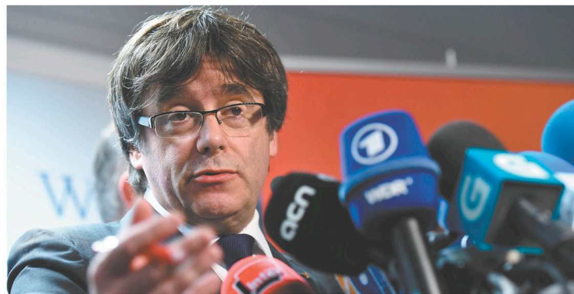
Carles Puigdemont avait affirmé pendant la campagne qu'en cas de victoire il rétablirait le gouvernement destitué.

Une façon de sous-entendre qu'il n'hésiterait pas à recourir à nouveau à l'article 155 de la