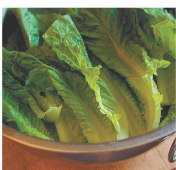
STEPHANIE PHILLIPS GETTY IMAGES