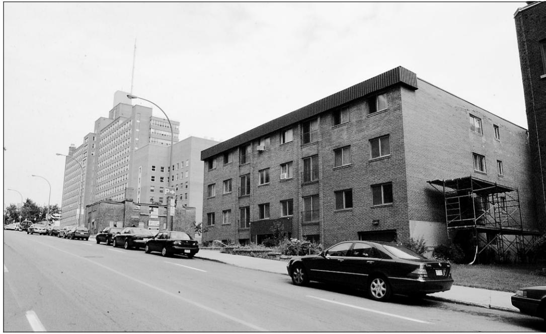
Un immeuble résidentiel de six étages pourrait prendre la place de cette maison centenaire, située au 1750, rue Cedar, sur l'arrondissement historique du mont Royal.

En 1999, le promoteur s'était vu refuser une première ébauche du projet par le ministre québécois de la Culture. À l'arrondissement, on soutient que la seconde mouture a reçu un avis préliminaire positif de Québec, ce qu'a nié, hier, le chef de cabinet adjoint de la ministre Line Beauchamp, Pierre Millette. « C'est impossible qu'il y ait eu un avis favorable, puisque le projet n'a même pas été présenté à la Commission des biens culturels », a-t-il dit.