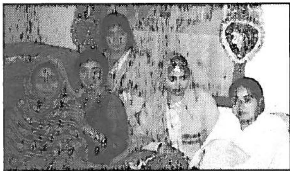
Pakistanaïses avec qui j'ai vécu en 1983

contraire (Rathgeber, 1994). Mal ajustés à la réalité quotidienne, les programmes d'intervention venaient plutôt s'ajouter aux tâches des femmes déjà surchargées de travail. Suite à une prise en compte du rôle incontournable des femmes dans le développement local, des arrangements technologiques ou dans l'organisation du travail ont été expérimentés pour faciliter leur participation, voire leur intégration. La