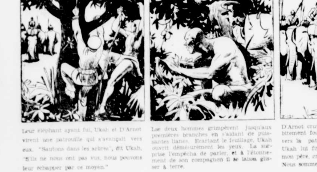
Le deux hommes grimèrent jusqu'aux premières branches en s'aidant de puissantes lances...