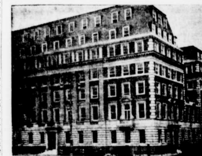
L'ambassade américaine à Londres, occupée par l'ambassadeur Joseph P. Kennedy, à vu ses fenêtres voler en éclats quand une bombe tomba tout près. Il n'y eut pas d'autres dommages.

Bien que les expériences de M. Ford pour accroître l'interdépendance de l'industrie et de l'agriculture se soient déroulées plus tôt dans « les couloirs » du bâtiment public. Un usage général de la vitre dans la construction du bâtiment permet de suivre facilement tous les stades du procédé d'extraction.