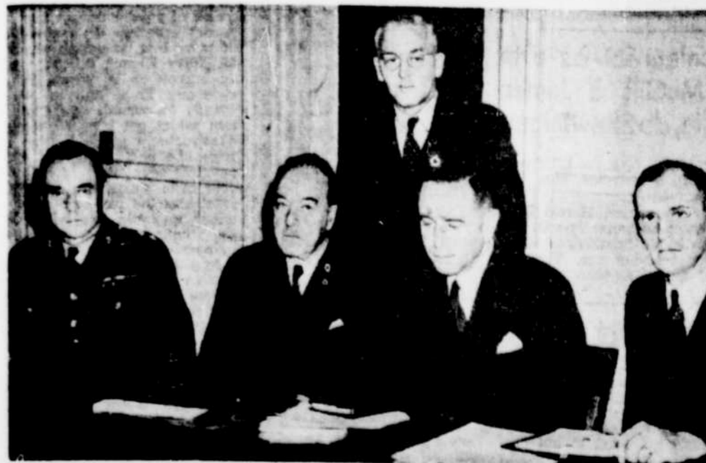
Le comité d'administration des Services Nationaux de guerre s'est réuni pour la première fois. Le comité aura le pouvoir d'accepter ou de rejeter la requête que pourraient faire certains chefs d'industrie, à savoir de différer l'entraînement de quelques-uns de leurs employés dont ils peuvent difficilement se passer et qui doivent se rapporter au camp pour le 9 octobre.