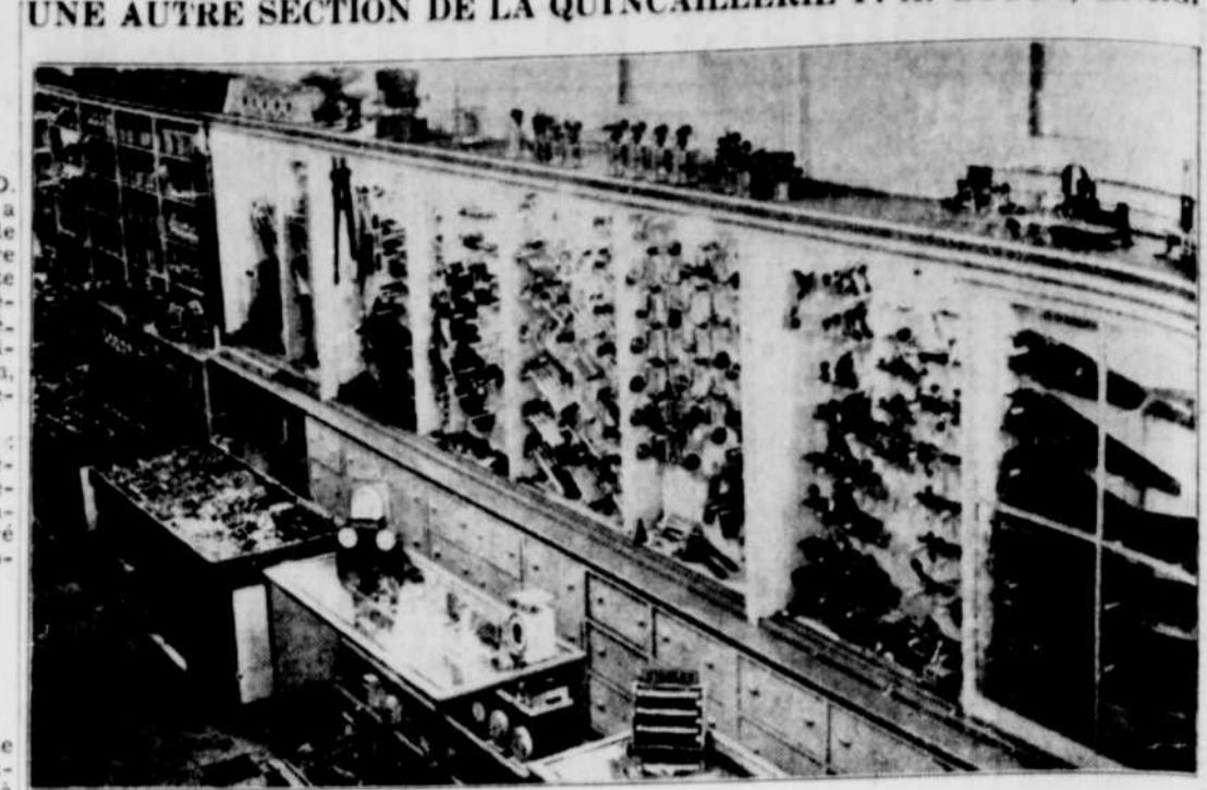
On aura vite fait de reconnaître dans cette illustration le rayon des outils situés dans l'ancienne partie du magasin P. A. Gouin, Engr., à droite, en franchissant le seuil d'entrée. — A noter comme le choix est rendu facile par suite de l'étalage complet de tous les outils usuels.