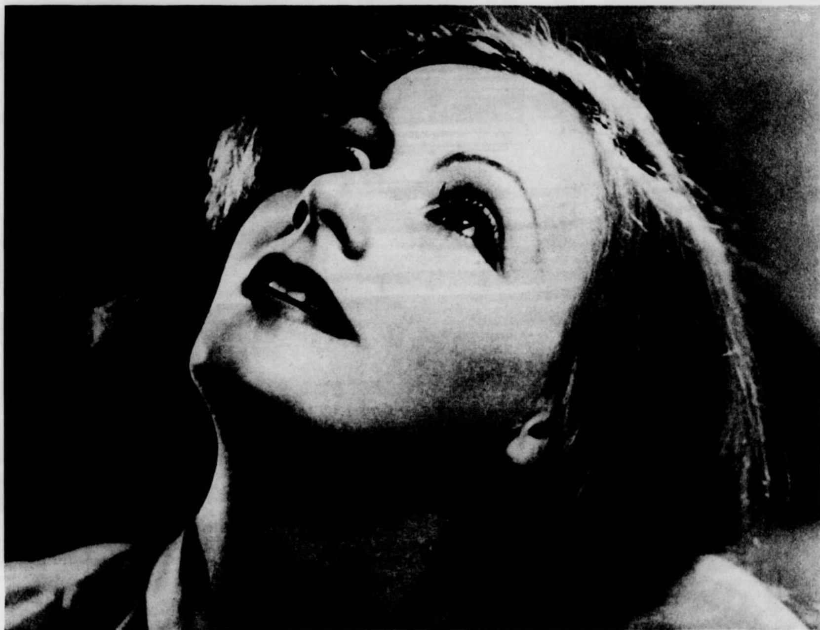
L'énigmatique Greta Garbo