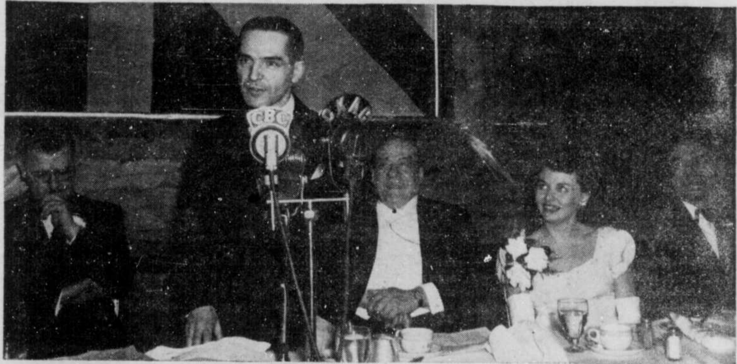
Me Gérard Delage, président de l'Union des Artistes