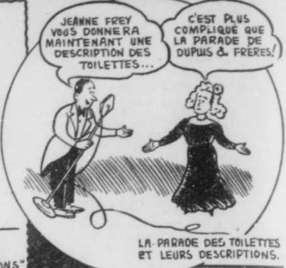
LA PARADE DES TOILETTES ET LEURS DESCRIPTIONS.