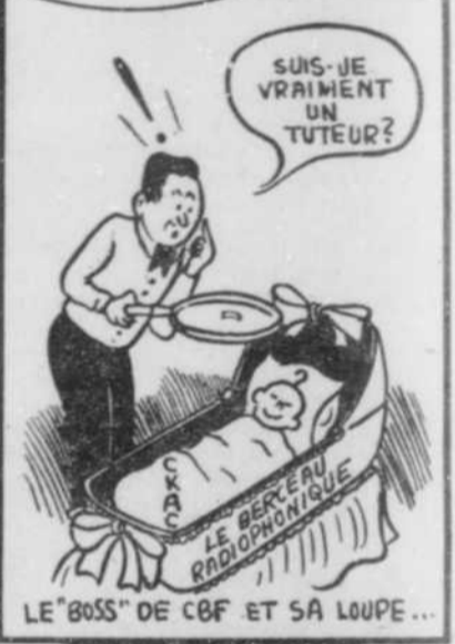
LE "BOSS" DE CBF ET SA LOUPE...