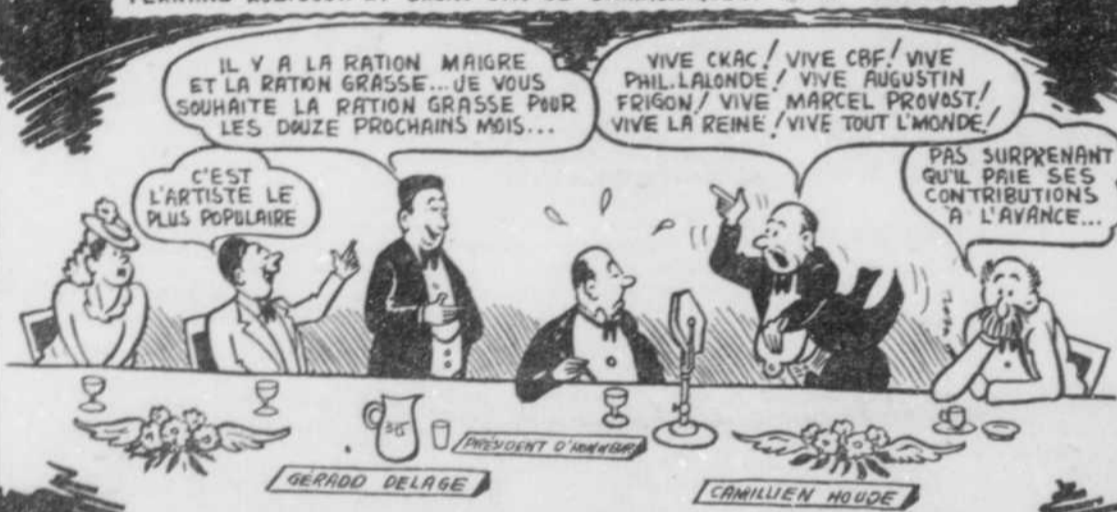
"QUELQUES PASSAGES DE DISCOURS IMPORTANTS."