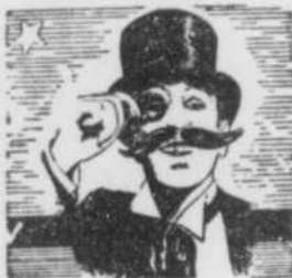
— PAR — L'ACADEMICIEN