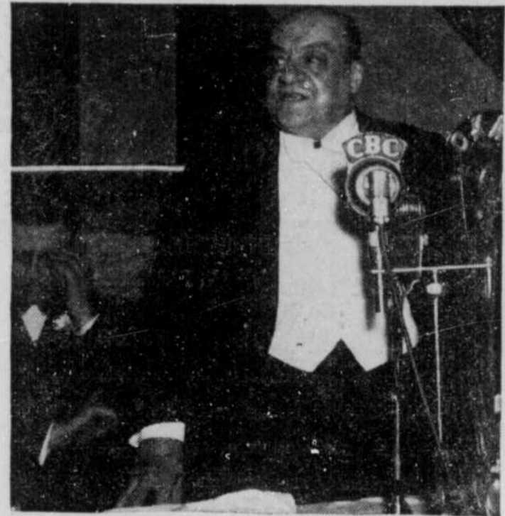
Son Honneur le Maire de Montréal.