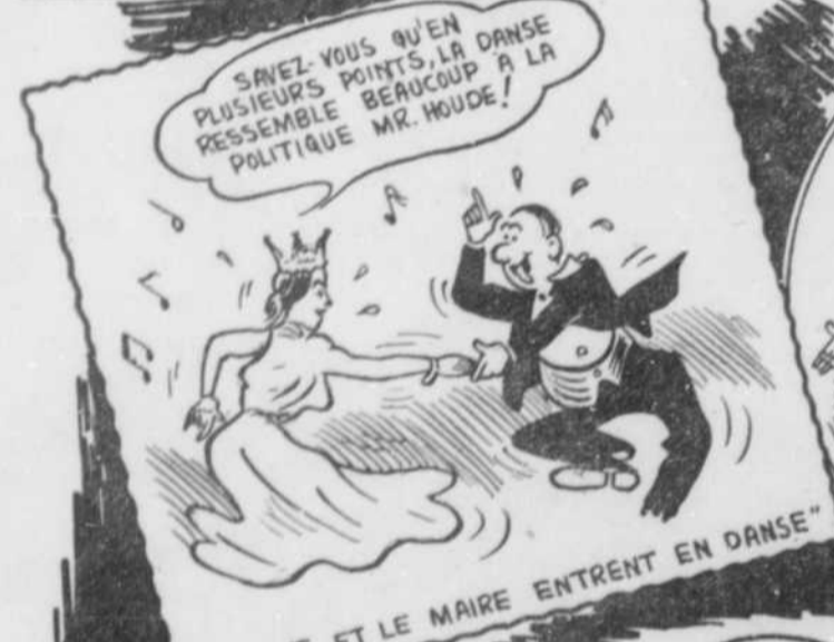
"LA REINE ET LE MAIRE ENTRENT EN DANSE"