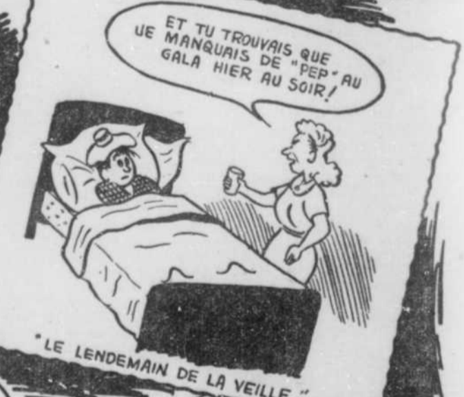
"LE LENDEMAIN DE LA VEILLE"