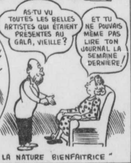
"LA NATURE BIENFAITRICE"