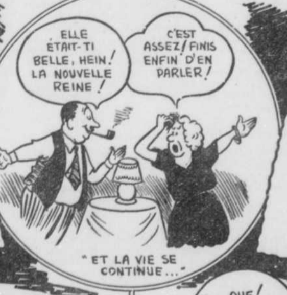
"ET LA VIE SE CONTINUE..."