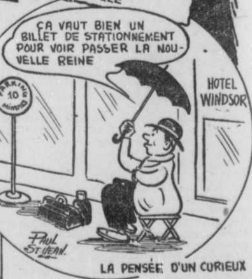
LA PENSÉE D'UN CURIEUX