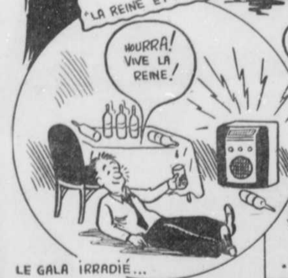
LE GALA IRRADIÉ...