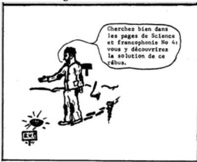
Fig. 1. Pauvreté... Extrait de SF4. Un pauvre gueux n'a guère de chances d'être entendu.

Chacun sait ou devrait savoir que l'appauvrissement du Québec dans la Confédération canadienne depuis 1841 a été un inconvénient jusqu'ici non réparé avec cette dette de l'Ontario envers le Québec estimée à 63 billions de $ en 1995; et que cet appauvrissement gêne la liberté de s'exprimer et de se faire entendre. Car pauvreté n'est pas vice, mais grand inconvénient. Fig. 1.