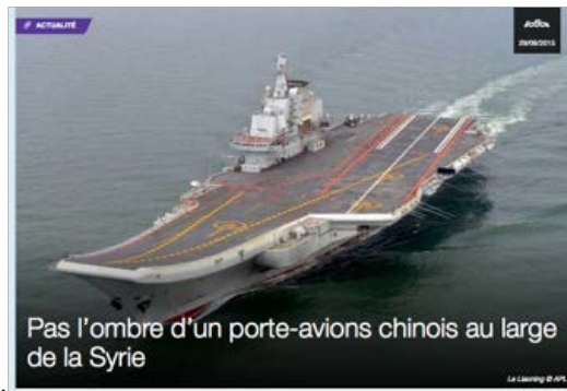
Fig. 5. Le Porte-avion chinois. Seul et unique. Son nom est Liaoning.

Les imaginations s'enflamment. Du moins la mienne. Que va devenir l'empire mondial anglophone? Surtout, on peut prévoir que les Québécois francophones changeront de rang, passant du rôle de quémandeur à celui de protecteur auprès de la soi-disante minorité anglophone locale et auprès de la soi-disante omnipotente majorité anglophone canadienne et mondiale.