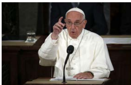
Fig. 1. Washington — Le pape François est devenu jeudi le premier pontife à prendre la parole devant le Congrès des États-Unis. On peut dire que l'événement affirme le droit de quiconque à la liberté d'expression.

Le pape a été accueilli par un tonnerre d'applaudissements quand il a fait son entrée dans la chambre principale du Capitole.