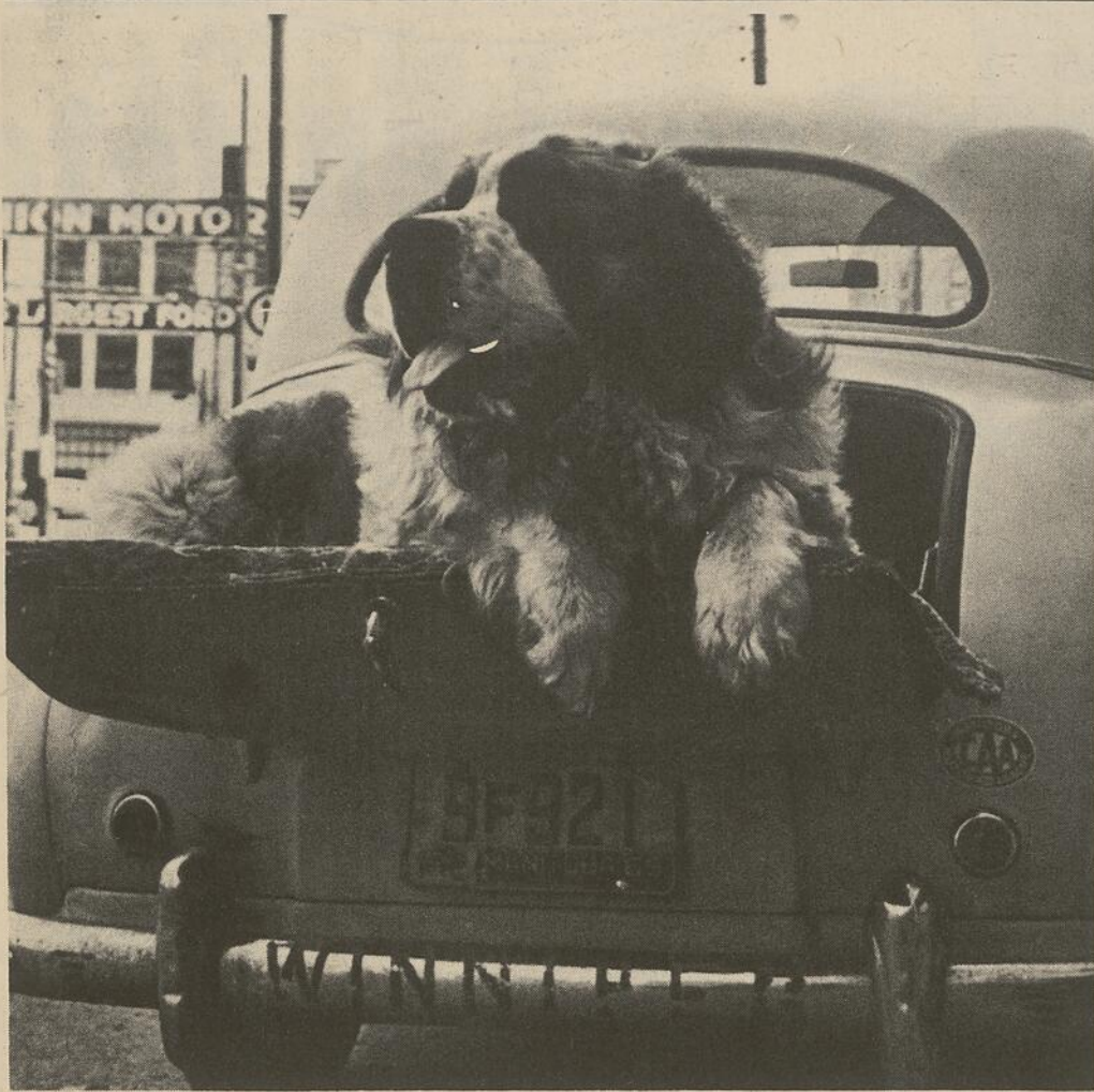
C'est un peu mieux qu'à pied. Ce chien St-Bernard semble fort bien apprécier la place qu'on lui a désignée. C'est d'ailleurs là qu'il saute chaque fois que son maître part en voyage, lorsqu'il fait beau. Quand il pleut, le chien prend place sur la banquette arrière, mais la voiture est si petite qu'il préfère la valise arrière.