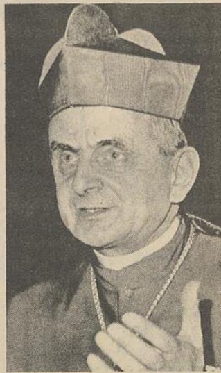
S.S. Paul VI

formules une explication plus claire et plus ouverte, mais ce sera toujours dans le sens selon lequel elles ont été adoptées par l'Église: ainsi la vérité immuable de la Foi restera intacte tandis que progressera l'intelligence de la Foi". Paul VI parle ensuite des diverses formes de présence de Christ dans l'Église, à travers la prière, les œuvres de miséricorde, la prédication, l'apostolat, l'administration des sacrements, revenant à la présence dans l'Eucharistie il dit: "Cette présence, on la nomme "réelle", non à titre exclusif comme si les autres présences n'étaient pas "réelles", mais tout en excellant, parce qu'elle est substantielle, et que par elle, le Christ, Homme-Dieu, se rend présent tout entier".