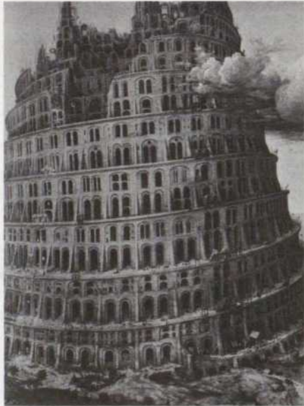
Érigée par les descendants de Noé, la Tour de Babel symbolisait la confusion des langues.