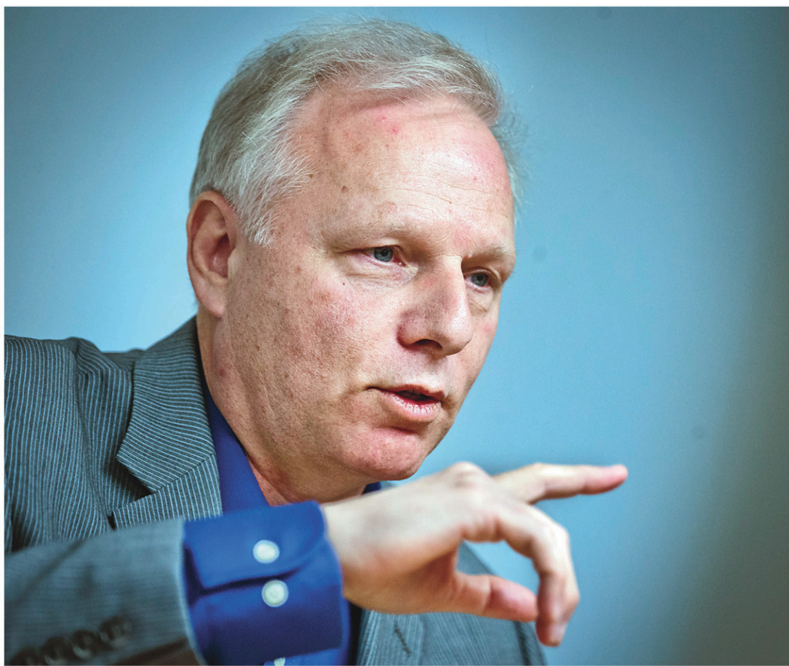
Le chef du Parti québécois, Jean-François Lisée

L'article 1 de la nouvelle proposition principale est rigoureusement fidèle à la position défendue par Jean-François Lisée lors de la course à la