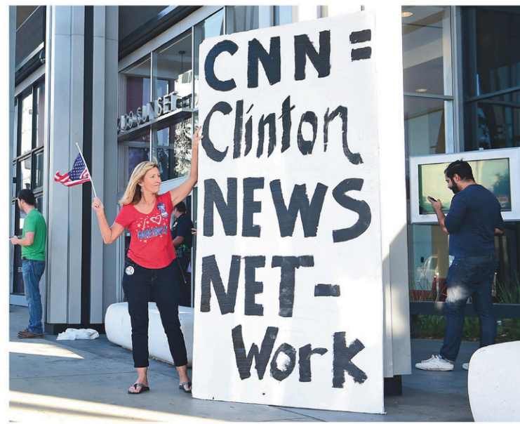
Les partisans de Donald Trump s'en sont pris au réseau CNN eux aussi, le qualifiant de « chaîne de nouvelles des Clinton ».

« Ca ne date pas d'hier le conflit avec certains médias et