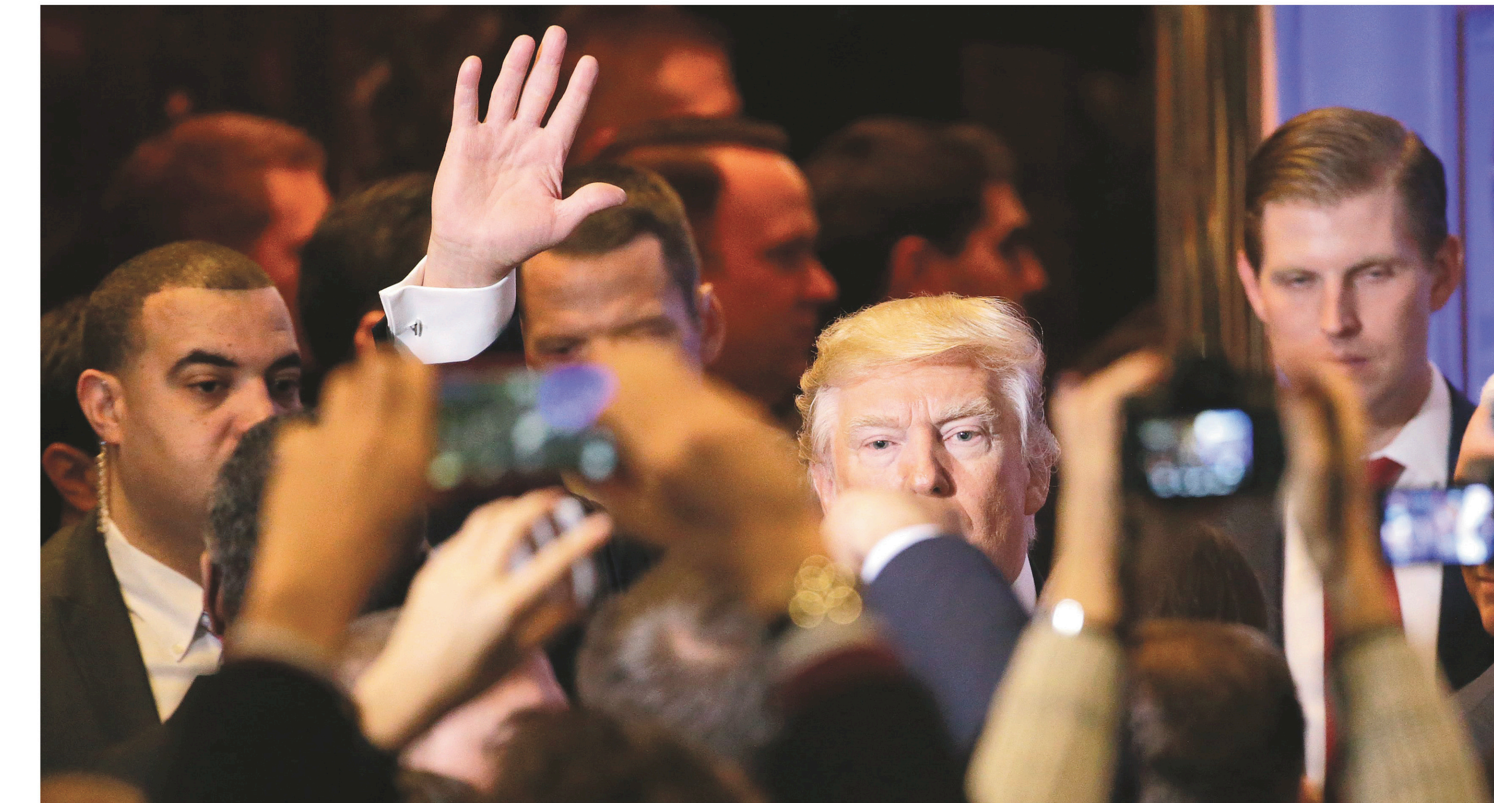
Des centaines de journalistes et de partisans ont assisté à la conférence de presse de Donald Trump mercredi.

La journaliste est convaincue que les Américains ont aussi été sensibles à l'appel de Trump selon qui on est d'abord Américain avant d'être Noir, latino ou femme. « Cela rappelle paradoxalement l'approche française de la citoyenneté républicaine, dit-elle. Alors