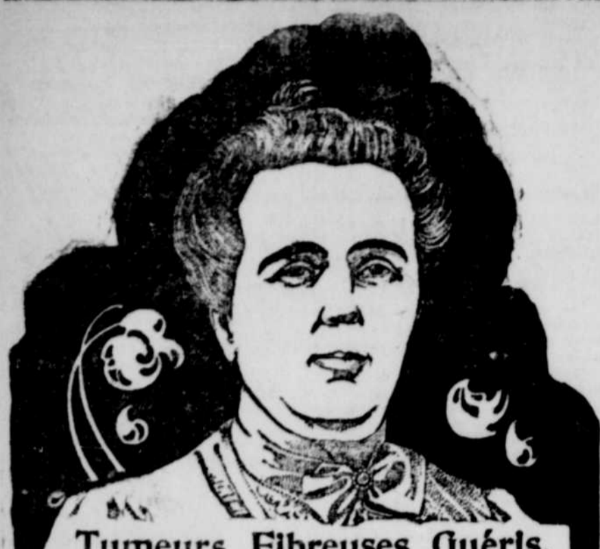
Tumeurs Fibreuses Guéris.