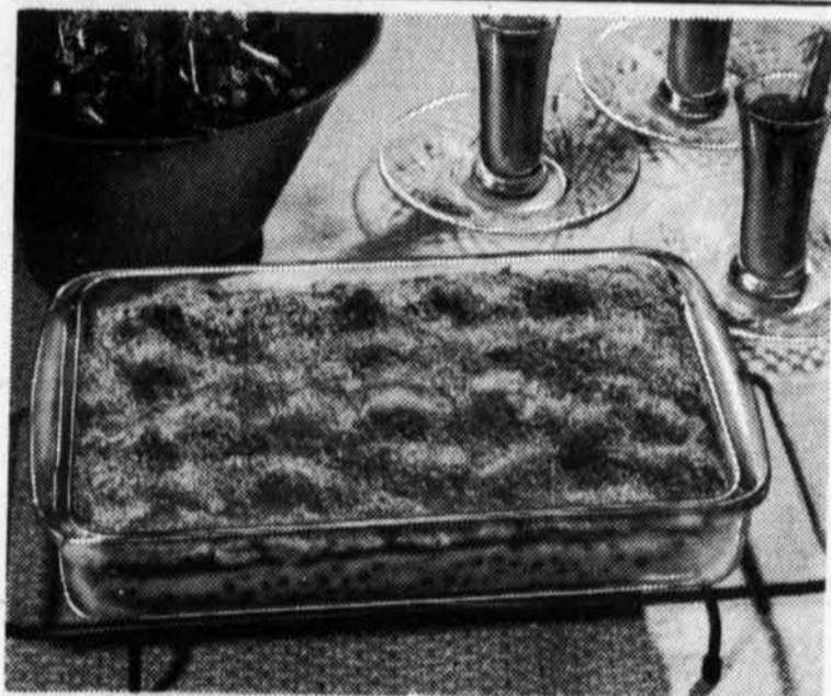
OEUF ET POIS AU GRATIN.

Ce plat, à la fois substantiel et appétissant, sera accueilli avec enthousiasme par tous les membres de votre famille. Selon la Section des consommateurs du ministère de l'Agriculture du Canada, il est parfaitement adapté aux journées froides de l'hiver et de plus, il se prépare rapidement. Déposez des moitiés d'œufs cuits dur sur des petits pois et nappez d'une sauce au fromage anctueuse. Saupoudrez d'un mélange de chapelure et de fromage râpé et dorez au four. Mmm... quel arôme et quel réconfort!