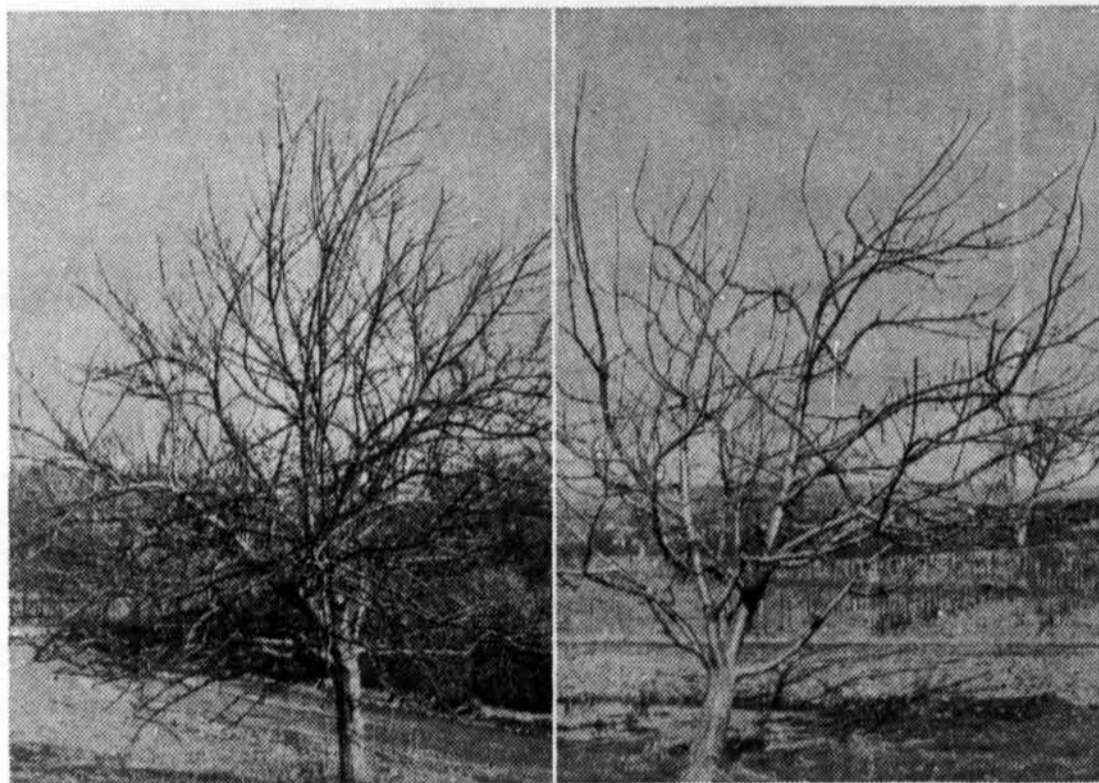
TAILLE DES POMMIERS—Le pommier de gauche n'est pas suffisamment taillé et il faudra lui consacrer beaucoup de temps pour lui donner une forme convenable. La taille du pommier de droite n'a jamais été négligée. Les branches principales s'attachent au tronc et aux grosses branches sous un angle ouvert, ce qui a pour effet d'en équilibrer et d'en dégager la charpente. Les deux photographies ont été prises à la station de recherches du ministère de l'Agriculture à Kentville (Nouvelle-Écosse).

Les branches d'importance secondaire sur l'arbre en croissance ne doivent être coupées que lorsque leur enlèvement ne produit pas de trouées dans la symétrie de l'arbre. Lorsqu'on les conserve, il en résulte des