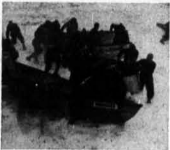
Le dimanche 9 février, "L'Univers des sports" vous conduira sur le Saint-Laurent afin de vous permettre d'assister à la course en canots du Carnaval de Québec. Ce reportage sera télévisé à compter de 3 heures.

10.30—Téléjournal 10.45—Supplément régional CBOFT—Dernière édition 10.54—Nouvelles du sport 11.00—Sport-éclair 11.30—Conférence Henri van Lier, écrivain belge: "Les Visages de la machine".