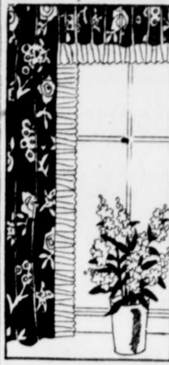
Vous vous suggérez ce modèle, mes dames, pour vos draperies de chambre. Rien de plus gai ni de plus "chic-sol".