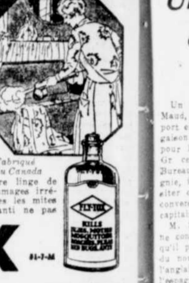
LES MITES NE PEUVENT PAS VIVRE AVEC FLY-TOX

Estomac sûr, indigestion, gas. C'est autant de signes, qui signifient la même chose, excès d'acidité. Les nerfs de l'estomac ont été sur-stimulés. Trop d'acide fait subir les vivres dans l'estomac et les intestins. Le meilleur moyen de corriger cet excès d'acidité c'est par un alcali. Le meilleur alcali que vous puissiez trouver est le Lait de Magnésie Phillips. Prenez une cuillerée de cette préparation sans danger et sans saveur dans un verre d'eau. Résultat instantané. L'estomac redevient normal. Cinq minutes après, vous ne souffrez plus! Les brûlements, gas, maux de tête, la bilieuse ou l'indigestion sont disparus! Lorsque vous connaissez le Lait de Magnésie Phillips, vous ne voulez plus employer d'autres méthodes. C'est le moyen agréable d'alcaliniser le système, de soulager les effets de l'acidité. Le Lait de Magnésie Phillips est recommandé par les médecins depuis plus de 50 ans. $0.50 la bouteille dans toutes les pharmacies. Soyez sûr d'obtenir le véritable. (Fabriqué au Canada).