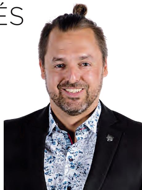
Xavier-Antoine Lalande, préfet de la MRC Rivière-du-Nord, conscient qu'il faut s'attaquer à la lutte contre l'itinérance.

À Gatineau, dans le cadre des Assises 2023 de l'UMQ, qui auront lieu du 3 au 5 mai prochain, l'enjeu de l'itinérance sera le thème d'une conférence sous le nom de : « Les municipalités, premières répondan-