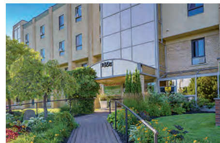
La Résidence du Verger vous accueille dans le secteur Lafontaine, à Saint-Jérôme.

Manoir les Retrouvailles Résidence du Verger www.residencescoqir.com