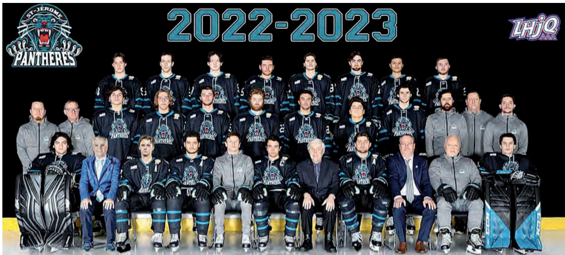
Voici l'édition 2022-2023 des Panthères de Saint-Jérôme