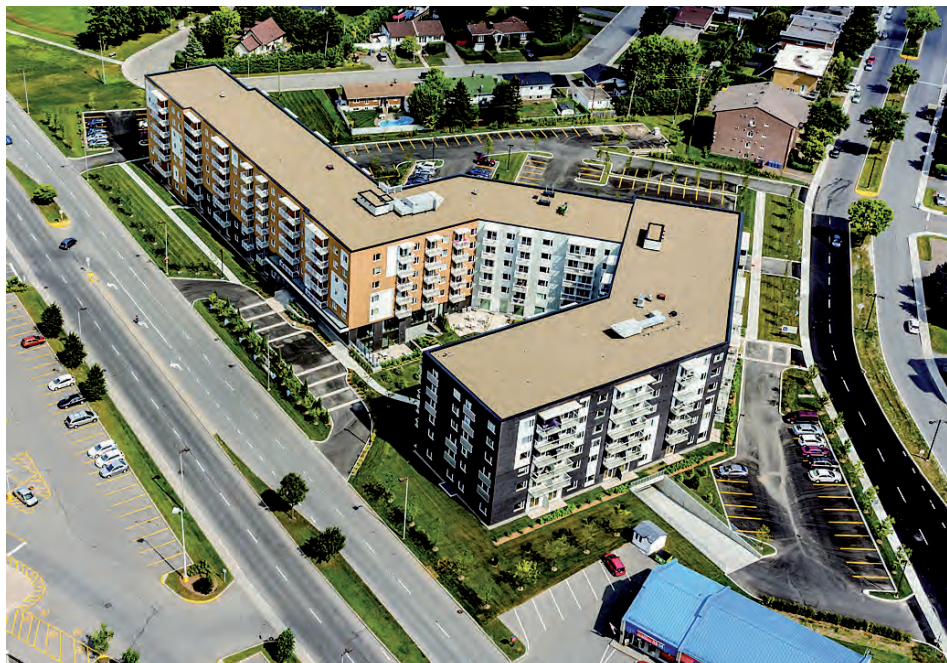
Le Sélection Retraite Saint-Jérôme est avantageusement situé au cœur du centre-ville de Saint-Jérôme.

Sélection Retraite Saint-Jérôme 685, boulevard Monseigneur-Dubois Saint-Jérôme 450 438-0770