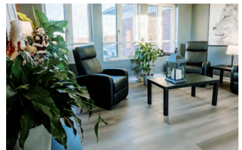
Le Manoir les Retrouvailles est situé dans un quartier paisible, à proximité du centre-ville de Saint-Jérôme.