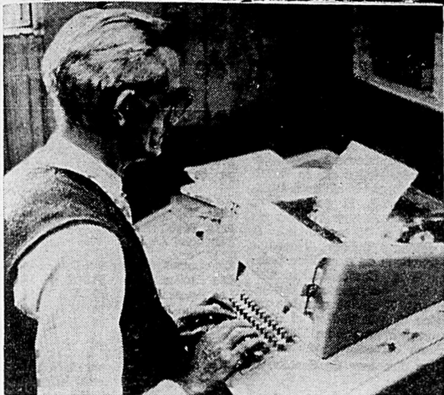
La compagnie Dufresne-Mannix emploie cet appareil TWX pour transmettre toutes ses données concernant les salaires à un calculateur, à Montréal. Une fois que le cerveau électronique a effectué tous les calculs voulus, les résultats sont retransmis au poste local, qui imprime des chèques auxquels il ne manque plus qu'une signature.