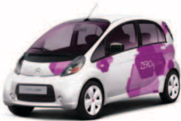
Taxi électrique Citroën C-Zéro à Paris

Des discussions sont en cours avec la Préfecture de Paris afin d'obtenir une dérogation permettant l'utilisation de la Citroën C-Zéro comme véhicule taxi électrique. Cette voiture compacte présente plusieurs avantages. Le principal est certes sa capacité de recharge rapide. En effet, on obtient une recharge à 80 % en 30 minutes en utilisant une borne de 125 ampères à 400 volts. D'autre part, l'autonomie de la voiture est de l'ordre de 130 kilomètres.