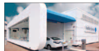
Taxi électrique en Israël

En conclusion, même si l'utilisation de véhicule électrique semble être la solution d'avenir, il nous faudra encore attendre quelques années avant que cela ne devienne la norme en matière de transport par taxi.