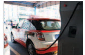
Taxi électrique en Chine