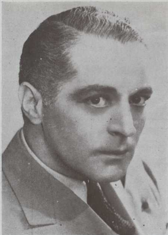
M. Marcel Journet