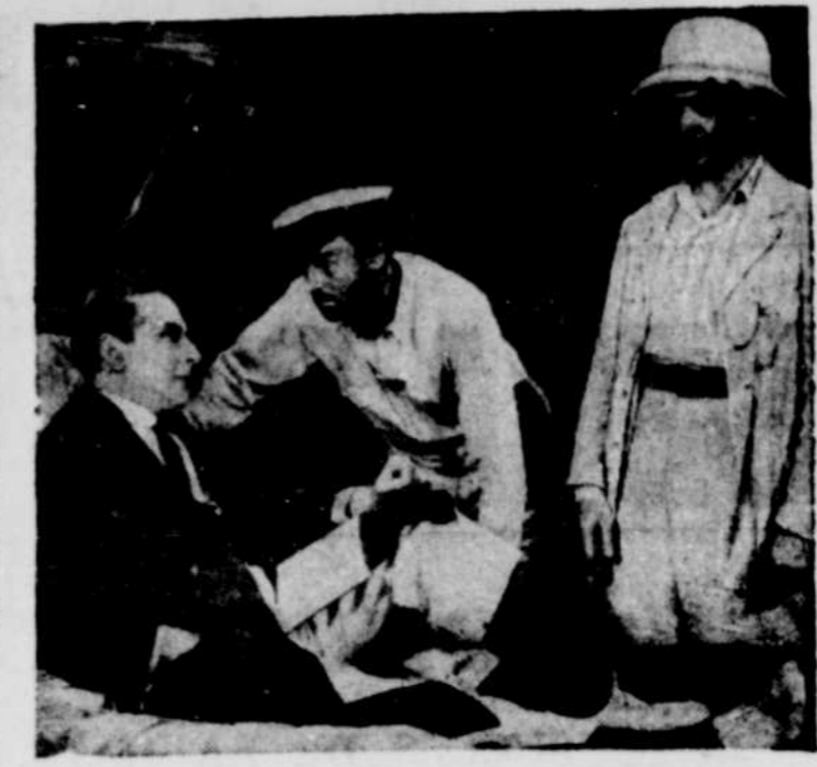
Voici une scène tirée du film "Victory" à l'affiche du Premier à partir de demain. L'histoire de ce film tourne autour de l'invasion par des bandits des îles des mers du Sud. Cette histoire d'aventure d'amour obtient un grand succès. Aussi à l'affiche, une désopilante comédie "It's a Great Life", avec Penny Singleton et Hugh Herbert.

Parlant de Bill Durnan, Dick Irvin déclare qu'il lui arrivera peut-être de laisser passer un coup facile mais jamais ou du moins très rarement de jouer une vilaine partie. "Bill n'est pas le type qui se décourage facilement après avoir été déjoué sur un coup facile", de dire Dick. "Bien au contraire, il devient plus vigilant que jamais. Il se surpasse pour faire oublier sa faiblesse". Irvin déclare que Durnan est un second Lorne Chabot en ce sens qu'il ne blâme jamais un autre joueur pour ses propres faiblesses. Lorsqu'il est déjoué sur un coup facile, Durnan ne se cache pas pour dire qu'il est lui-même responsable de ce point et que personne autre ne doit être blâmé pour le coup.