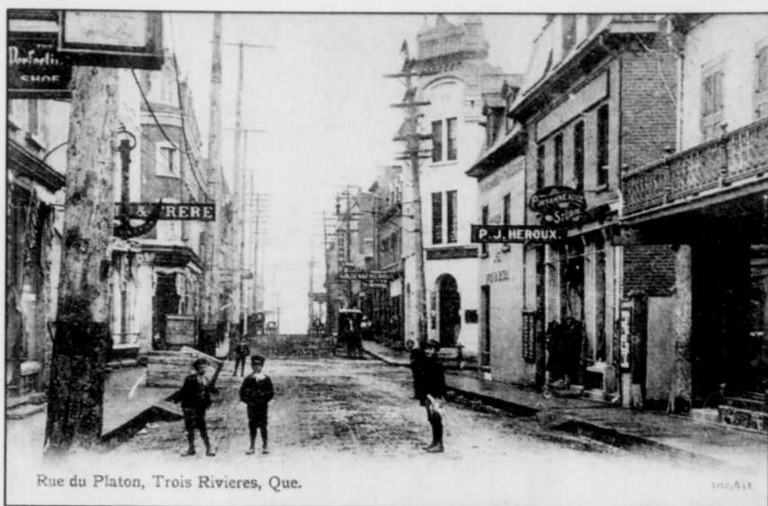
Rue du Platon, Trois-Rivières, Que.

Appartenance Mauricie Société d'histoire régionale est un organisme à but non lucratif qui compte près de 500 membres. Fondé en 1995, il s'est donné pour mission de faire connaître et de mettre en valeur l'histoire de la Mauricie.