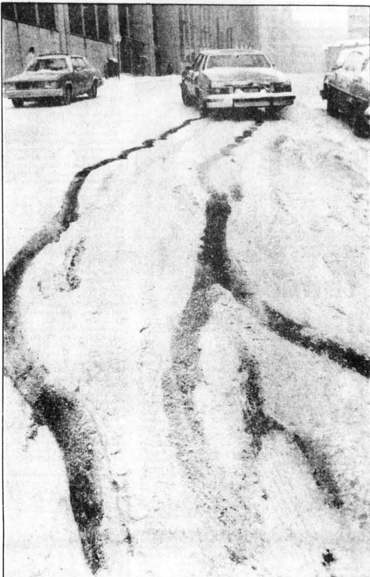
Côte du Beaver Hall, 16 h, hier...

À 19 h, le mercure indiquait encore moins 4 à Dorval. Il devait remonter doucement durant la nuit et la pluie devait durer toute la soirée et une bonne partie de la nuit. Elle tombait peut-être encore quand le porteur est venu vous