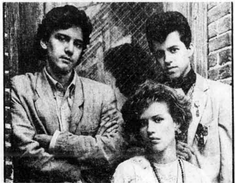
A JOHN HUGHES PRODUCTION

«... Captivant, étonnant et romanesque.» Richard Corliss, TIME MAGAZINE «Un dénouement d'une noblesse irrésistible.» Janet Maslin, NEW YORK TIMES «Le jeu des comédiens est superbe. On ne pourra s'empêcher d'adorer ce film.» Joe Siegel, WABC-TV «Un conte de fées branché.» Jack Curry, USA TODAY «★★★★½... D'une honnêteté sans reproche, ce film traite de préoccupations réelles, notamment l'amitié et le sentiment d'appartenance.» John Corcoran, KABC-TV «★★★. Pretty in Pink, un film reconfortant...» Roger Ebert, CHICAGO SUN-TIMES «... Enjoué, courageux, vulnérable...» Joseph Gelmis, NEWSDAY