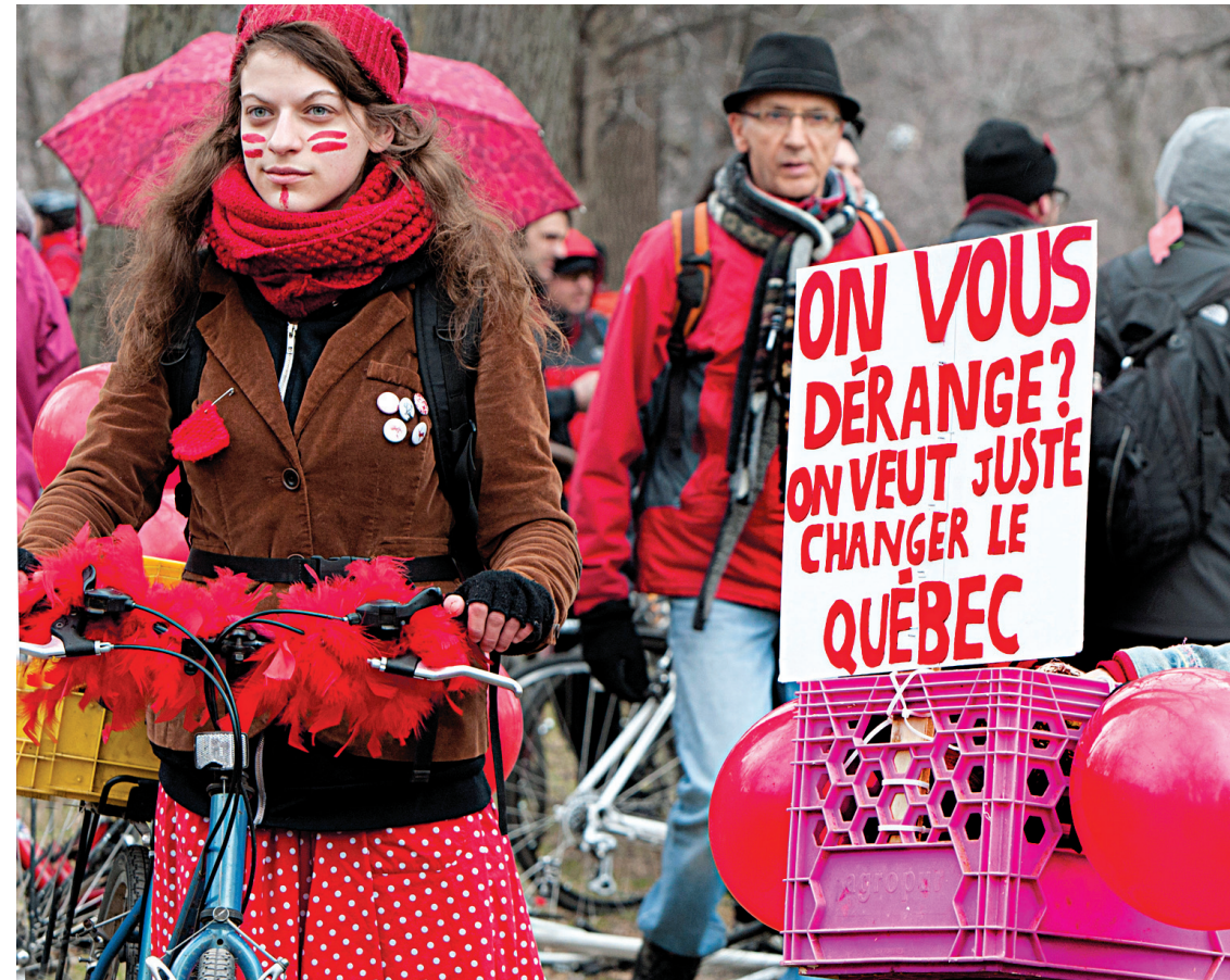
Environ 80% des étudiants universitaires ont complété leur session avant les vacances.