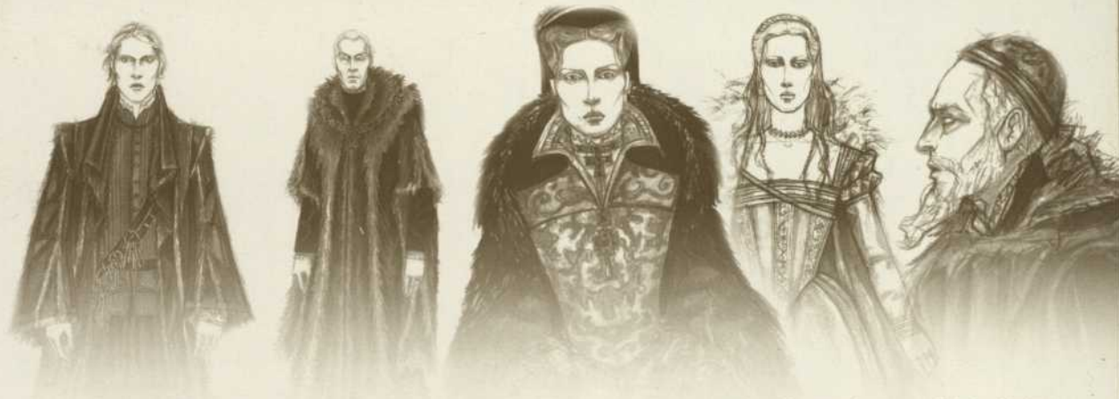
Maquettes de costumes: Catherine Higgins