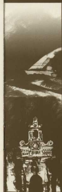
Dessins de Victor Hugo

L'acteur est porteur de paroles. Peu importe l'auteur et sa forme d'écriture, si un acteur me touche, ose, propose, risque et s'abandonne, cela me stimule dans ma façon de sculpter une œuvre. Il n'y a pas d'idéal, il n'y a que de la passion.