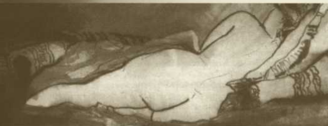
Dessin de Victor Hugo

afin que celui-ci ne lui file pas entre les doigts. Hugo doit livrer un texte le 1 er septembre, nous sommes en mai, il débutera en août. Trois semaines plus tard, la pièce Marie Tudor est terminée.