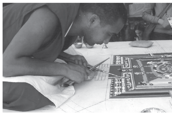
Délégué bouddhiste à Melbourne, en Australie Buddhist delegate in Melbourne, Australia