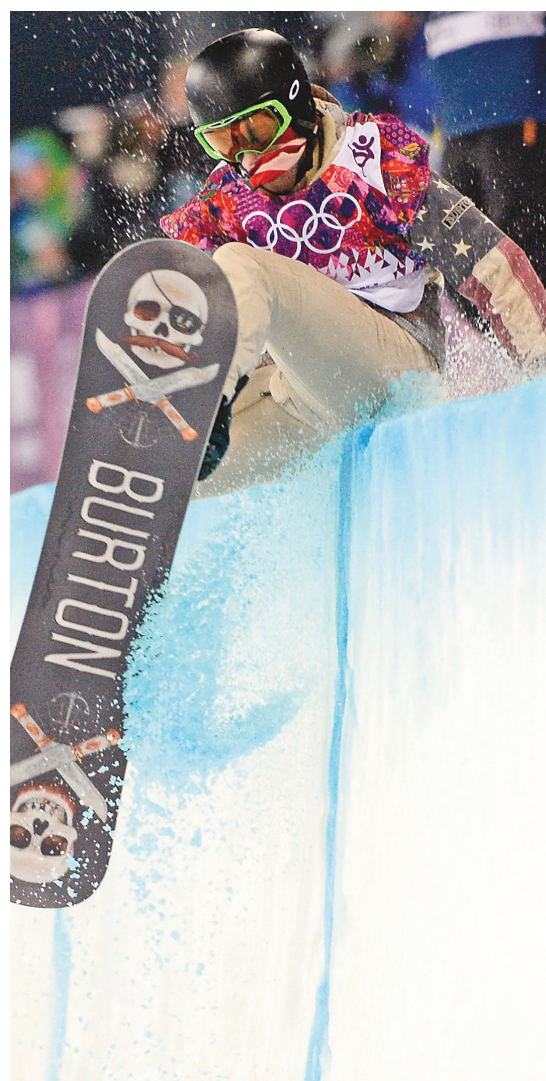
L'Américain Shaun White a heurté la crête de la demi-lune lors de la finale.