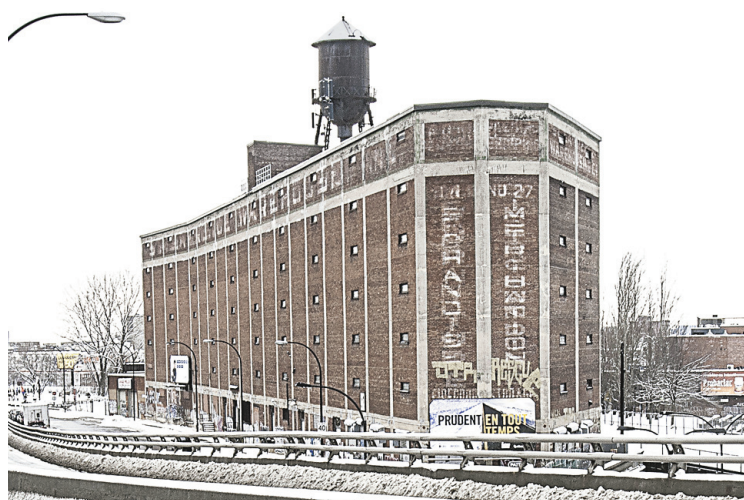
De haut en bas : la maison Pierre du Calvet dans le Vieux-Montréal, l'école Baril de la rue Adam et l'entrepôt Van Horne