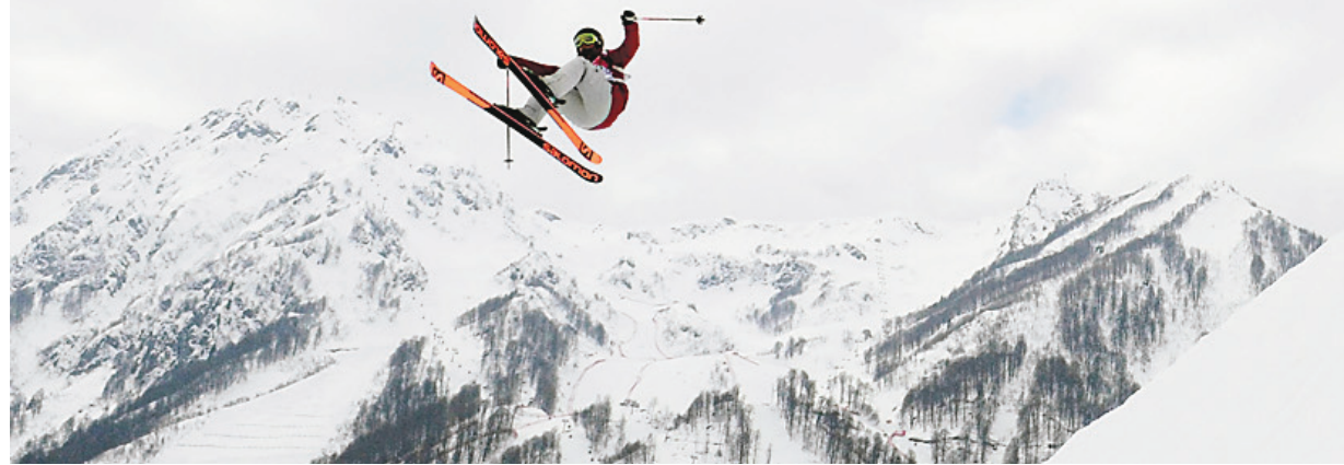
Dara Howell prend son envol dans le Parc extrême de Rosa Khoutor. Ses bonnes performances lors des qualifications et de la finale lui ont permis d'obtenir la médaille d'or.

L'Ontarienne Dara Howell et la Québécoise Kim Lamarre décrochent l'or et le bronze lors de l'épreuve de slopestyle