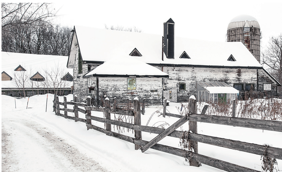
Datant du XIX e siècle et agrandie par les frères Edward et W. S. Maxwell, la grange-étable du domaine Bois-de-la-Roche rappelle l'existence de fermes sur l'île.

Aux prises avec des problèmes de moisissures depuis 2011, les écoles Baril, Hoche-laga et Saint-Nom-de-Jésus de