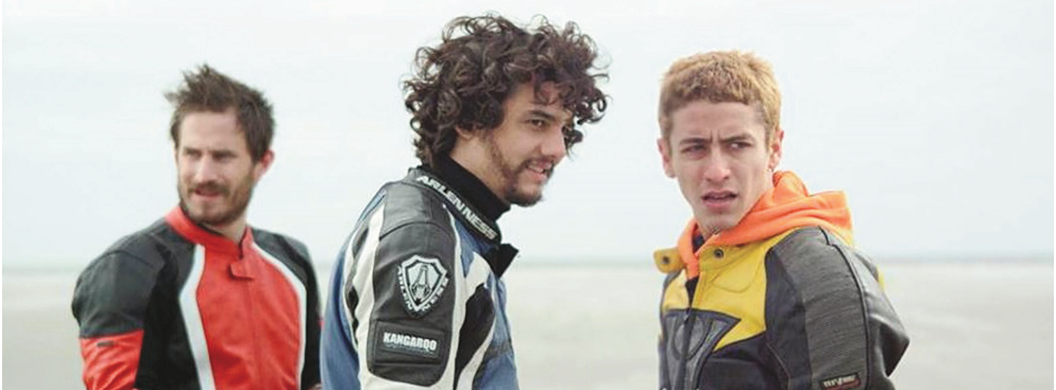
Clemens Schick, Wagner Moura et Jesuita Barbosa dans une scène de Praia do futuro , du cinéaste Karim Aïnouz