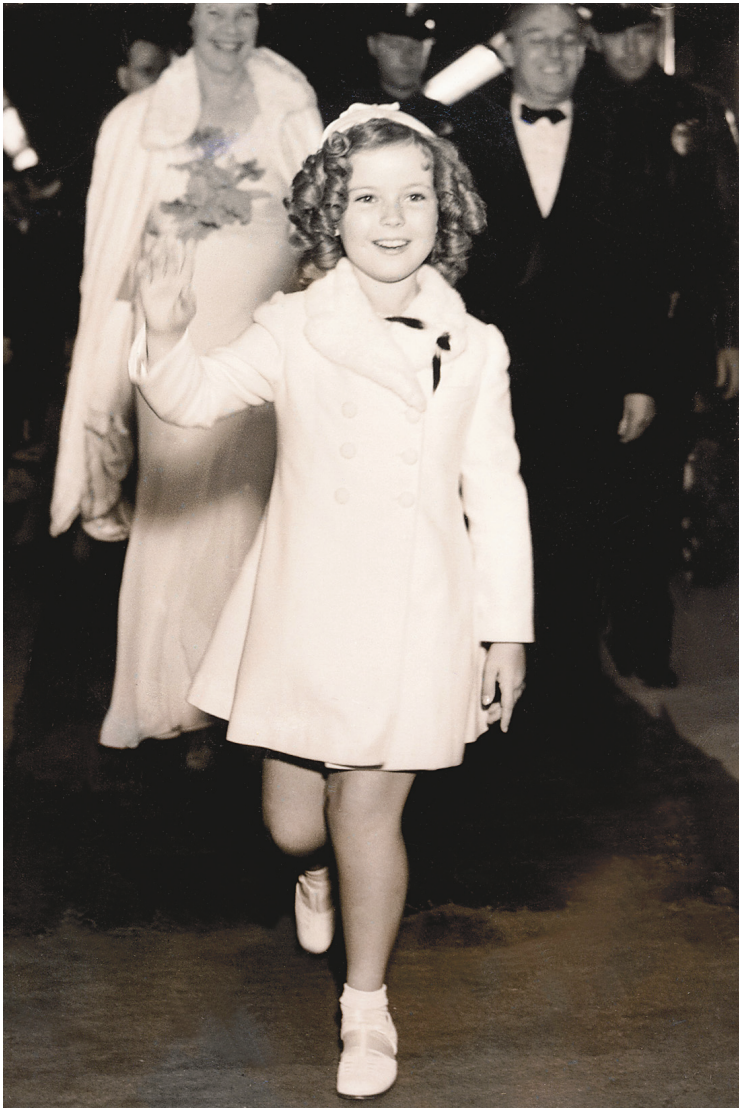
Le 26 juin 1937, Shirley Temple se rend à la première du film Wee Willie Winkie , à Hollywood.

CONSTANTINOPOLE Les voyages musicaux de Marco Polo Dimanche 23 février 2014, 19h Maison Symphonique de Montréal