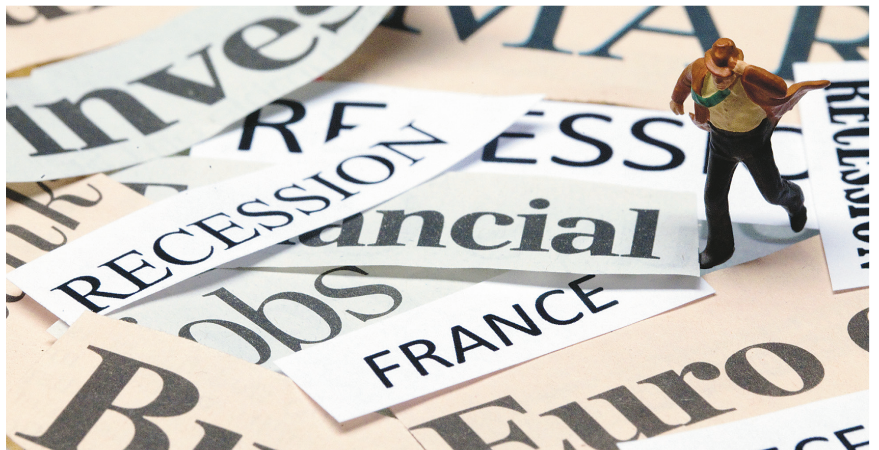
JOËL SAGET AGENCE FRANCE-PRESSE