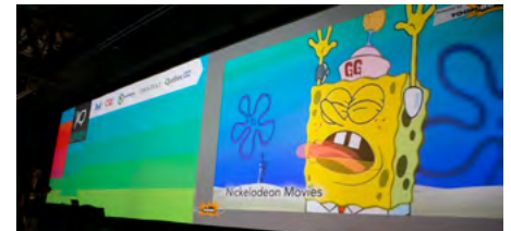
Une conférence de clôture axée sur le divertissement et l'éducation présentée par Toon Boom.