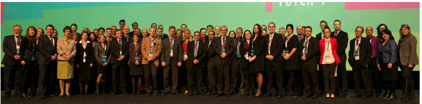
Une très belle équipe associée au succès de la JIQ 2013. Les membres du comité organisateur en compagnie des bénévoles de la journée.