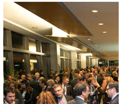
Un moment de détente entre deux conférences.