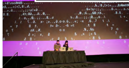
Ouverture technologique avec la VJ Mâ.