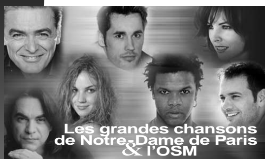
Les grandes chansons de Notre-Dame de Paris & l'OSM