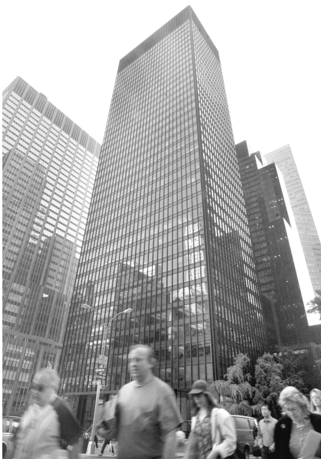
La rétrospective Mies en Amérique réunit une multitude de dessins, de photographies et des maquettes de quatre de ses édifices clés dont le siège social de Seagram à New York.