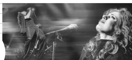
Isabelle Boulay & l'OSM