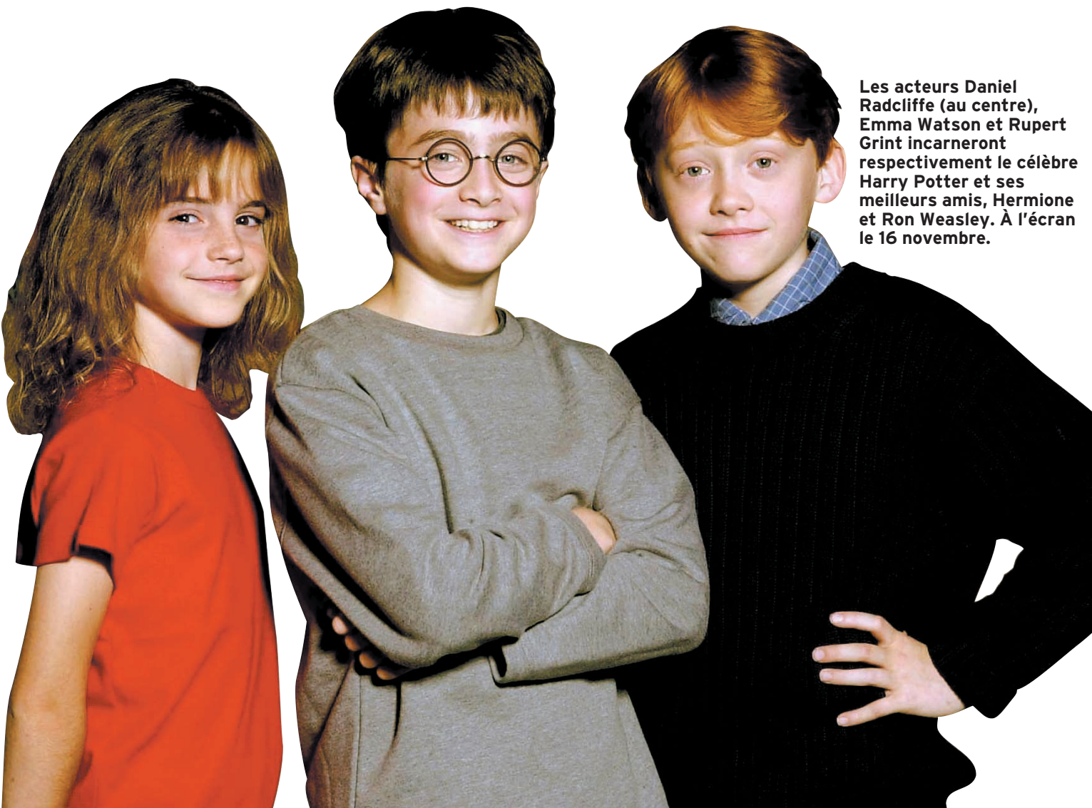
Les acteurs Daniel Radcliffe (au centre), Emma Watson et Rupert Grint incarneront respectivement le célèbre Harry Potter et ses meilleurs amis, Hermione et Ron Weasley. À l'écran le 16 novembre.

La course aux Oscars s'annonce particulièrement serrée.