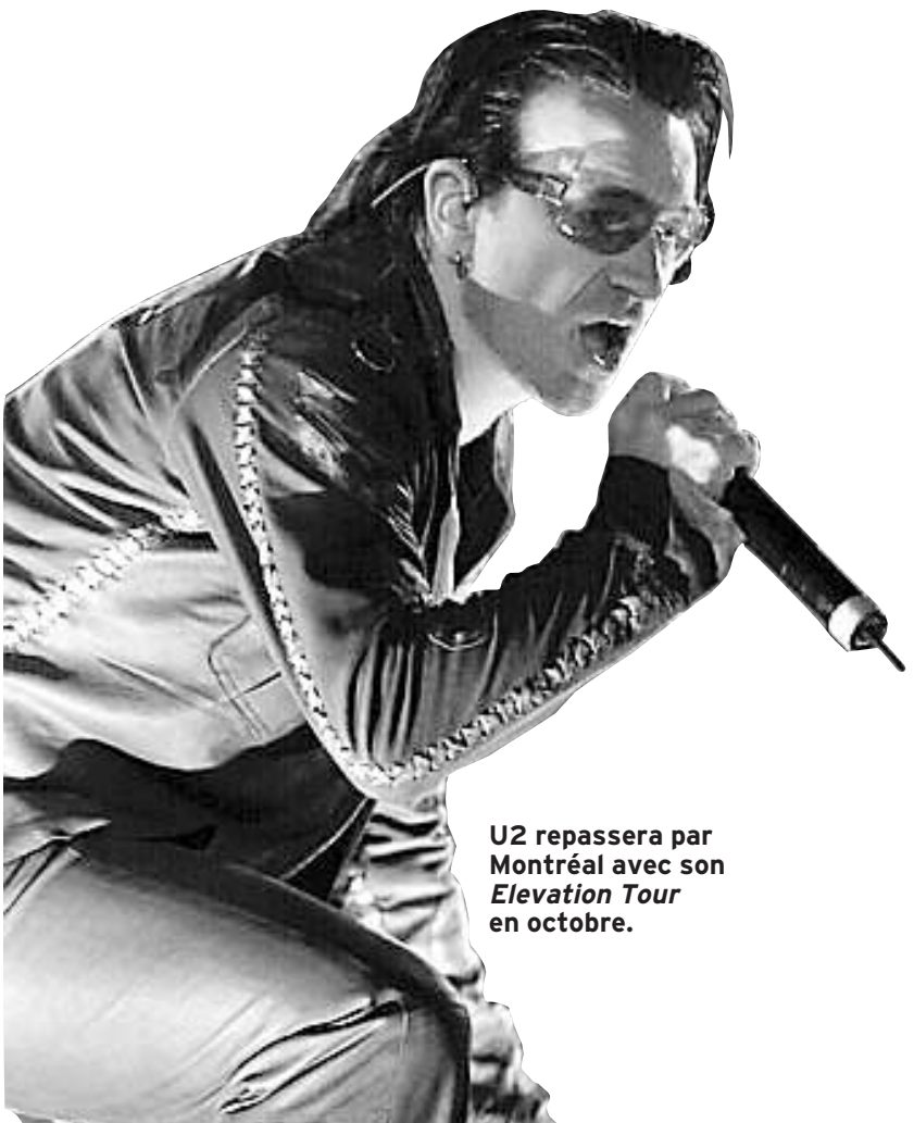
U2 repassera par Montréal avec son Elevation Tour en octobre.