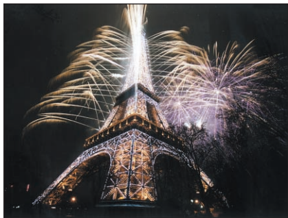
Le Groupe F, qui avait illuminé la tour Eiffel pour l'an 2000, égaiera l'ouverture de la saison avec un triple spectacle pyrotechnique très musical.