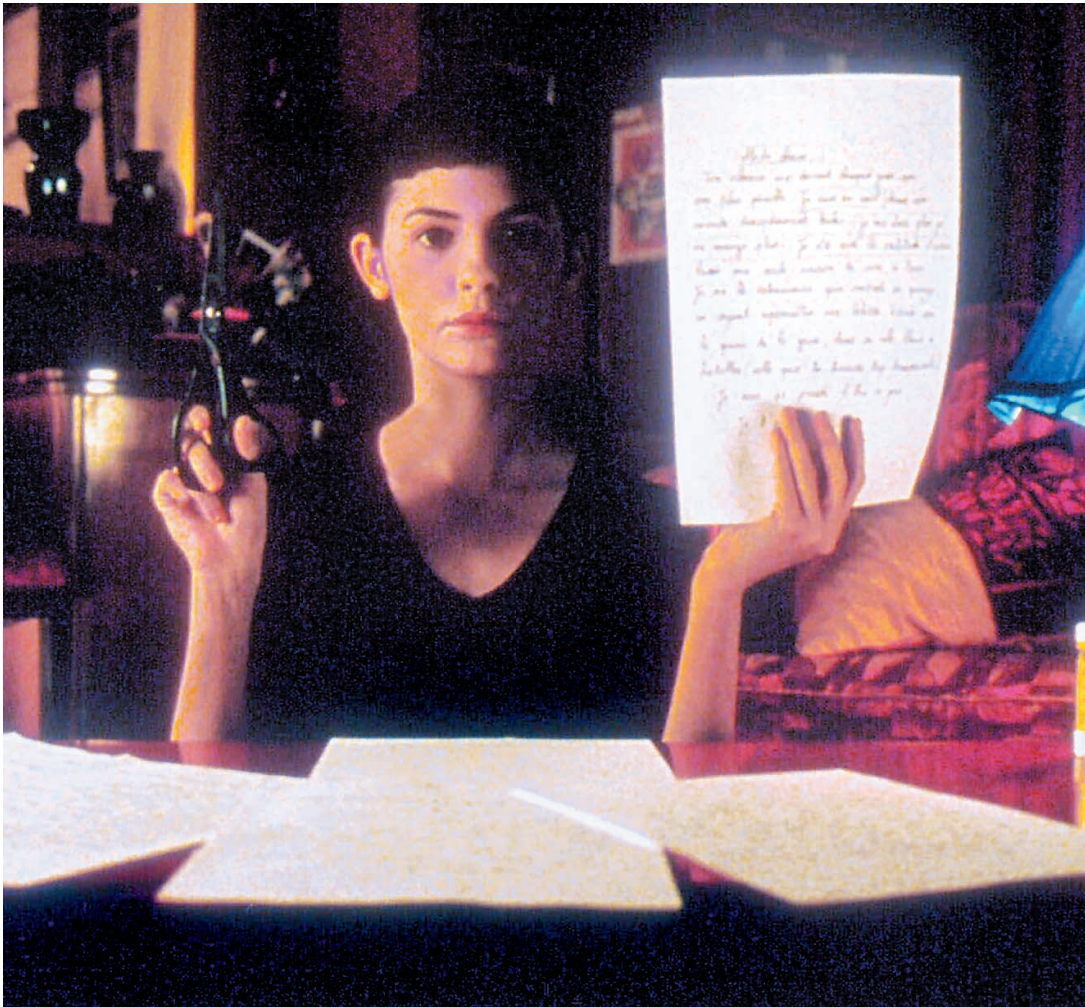
La saison s'ouvre avec une production française qui fracasse les records d'assistance sur son territoire : Le Fabuleux Destin d'Amélie Poulain .