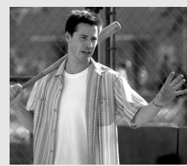
Keanu Reeves dans Hard Ball