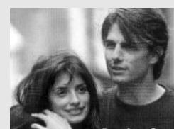
Tom Cruise dans Vanilla Sky