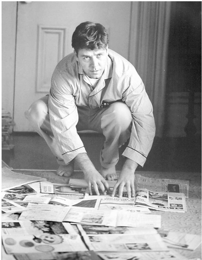
L'oscarisé Russel Crowe incarne un génie des mathématiques qui combat la maladie mentale dans A Beautiful Mind , de Ron Howard.