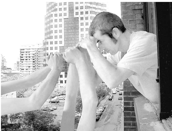
Mieux voir est une création d'Éric Madeleine, présentée dans le cadre du Mois de la photo.

Au-delà de ces deux regroupements, France au Québec/la saison s'étale sur tout le territoire québécois incluant même les centres artistiques les plus éloignés, ceux-là qu'on oublie trop souvent à Montréal. Dans la section Nouvelles images (vidéo et nouveaux médias), L'Écart de Rouyn-Noranda accueille, jusqu'au 28 septembre, Santiago Reyes, Clémentine Roy et Yeon Hee Park. Jusqu'au 12 octobre, la galerie Sé-