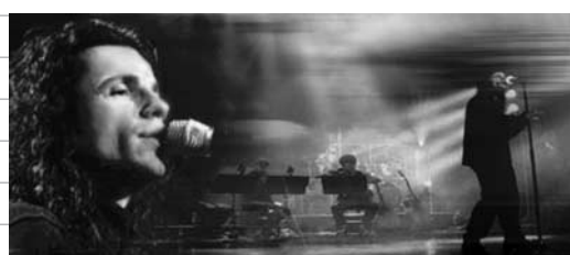
Bruno Pelletier & l'OSM