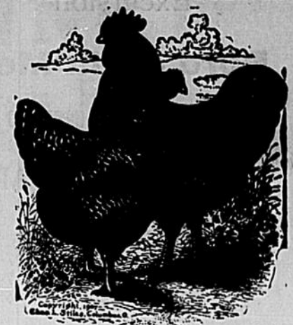
Plymouth Rock Barrée.

Il me fait plaisir d'annoncer à mes nombreux clients, que je viens de recevoir un TRIO de PLYMOUTH ROCK BARRÉE importée des Etats-Unis, du plus grand éleveur de cette race, "Hawkins", "Blue Strain". Ces volailles sont descendantes primées au "New York Show" et trois coquets de la même lignée se vendaient à la dernière exposition $500 chacun.