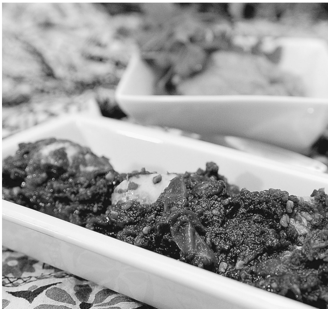
Curry de poisson au tamarin