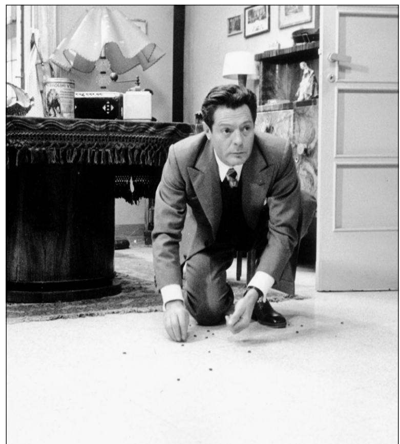
Le célèbre acteur italien Marcello Mastroianni a interprété le rôle d'un homosexuel persécuté par les fascistes, dans le film Une journée particulière d'Ettore Scola.

L'Italie, alliée du régime hitlérien au début de la guerre de 1939-1945, a été occupée par les nazis après le débarquement des alliés anglo-américains dans le Sud et l'armistice proclamé le 8 septembre 1943. Des lois raciales contre les Juifs avaient été promulguées par Mussolini et contresignées par le roi Victor-Emmanuel II dès 1938.