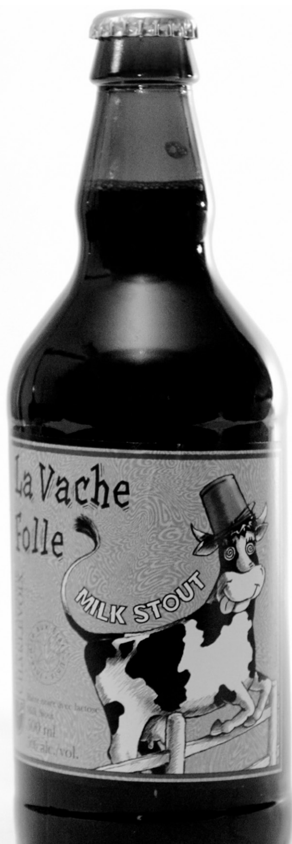
La vache est déglinguée, l'amertume émoûsée.