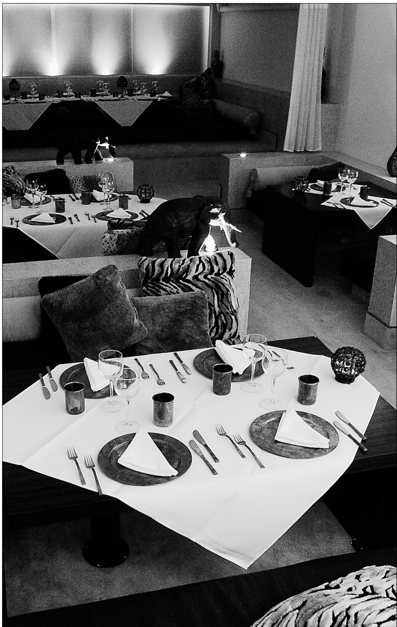
La salle à manger du restaurant Atma est très bien aménagée, chaleureuse et moderne. On trouve des chaises et des tables au ras du sol sur la mezzanine pour un dépaysement charmant.

Est-ce que ce restaurant pourrait s'améliorer ? Oui, en offrant, en plus des valeurs sûres, de nouvelles créations issues du répertoire varié de la cuisine poudjâbi en particulier et indienne en général. Parce que nous sommes prêts à la découvrir.