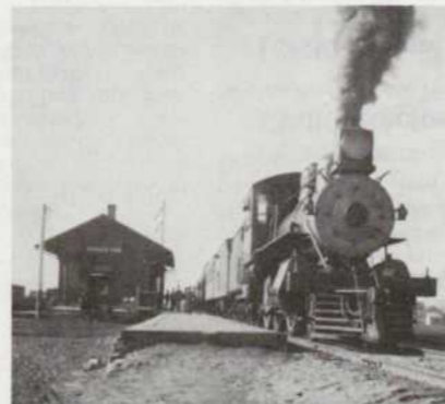
Le «Burlington» no 1 arrive à Princeton, Illinois, en 1900