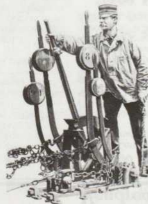
La sécurité des voyages en chemin de fer était assurée grâce aux aiguilleurs consciencieux prêts à la manoeuvre.