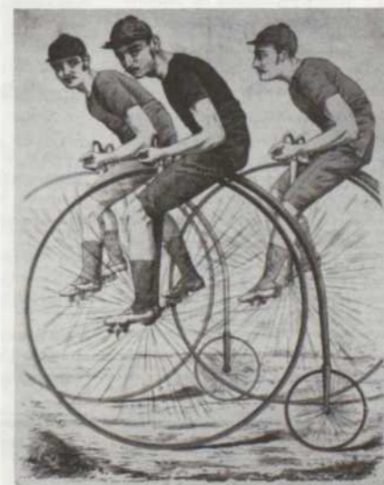
Attention messieurs, la course commence! Ce n'est pas encore le tour de France mais on y arrive.