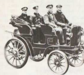
Rien de tel, par un beau dimanche, qu'une promenade dans une magnifique «Stoewer» 1899!