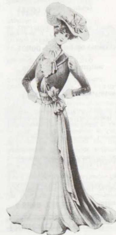
La Haute Couture vers 1900