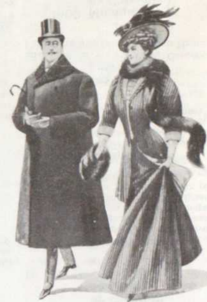
La mode anglaise (1907)