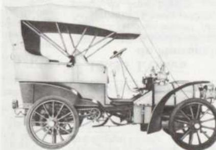
Une «Fiat» 12cv (1901-1903)