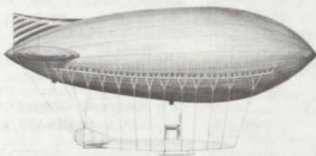
Dirigeable britannique «Baby» (1909)

Avec près de quatre-vingts ans de recul, le FM de Radio-Canada vous offre une vision étonnante du XXe siècle naissant à travers une série de vingt émissions intitulée LE GLOBE-TROTTER et présentée les jeudis à 19 heures à compter du 15 avril.