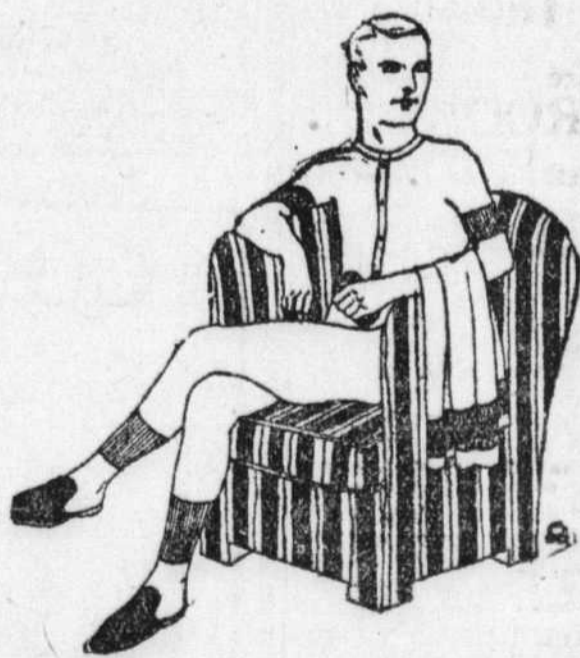
Votre marque favorite est dans notre assortiment de