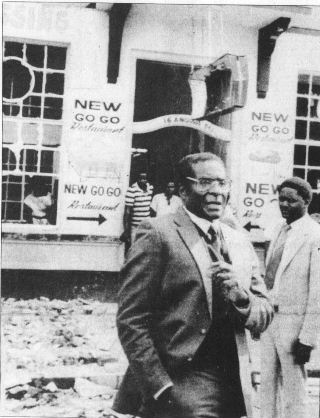
Le premier ministre du Zimbabwe, M. Robert Mugabe, s'est rendu hier au quartier général de l'ANC, à Harare, pour constater l'ampleur des dommages causés par l'attaque sud-africaine.