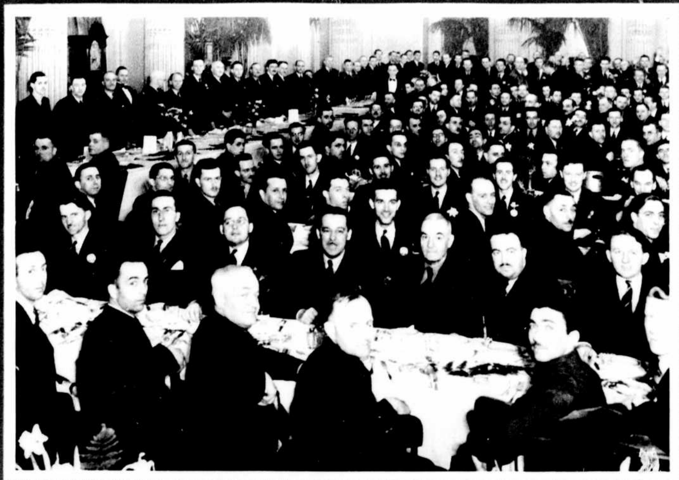
Le banquet au profit du parlement tenu des locaux à l'Hotel de la Chambre de commerce des jeunes, le 11 mars 1942.

DE LA CHAMBRE DE COMMERCE DU DISTRICT DE MONTREAL ET DE LA CHAMBRE DES JEUNES