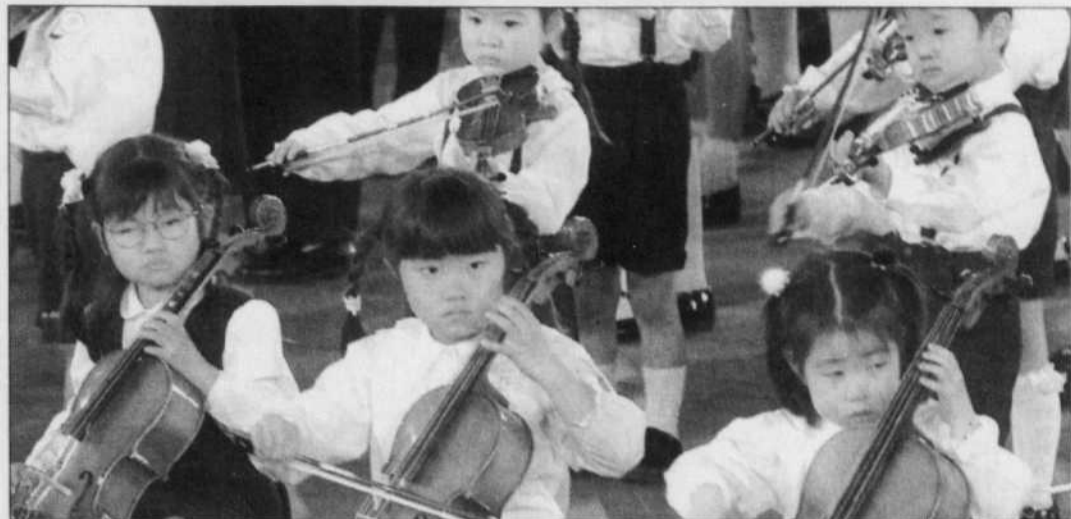
De petits humains sans défauts, ou presque? La réalité pourrait fort bien rejoindre la science-fiction, et plus tôt qu'on ne le pense.

Selon Stock et Fukuyama, lorsque l'humain aura accès à son