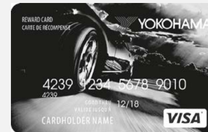
CARTE VISA PRÉPAYÉE YOKOHAMA

OFFRE VALIDE 15 SEPTEMBRE AU 15 DÉCEMBRE 2018