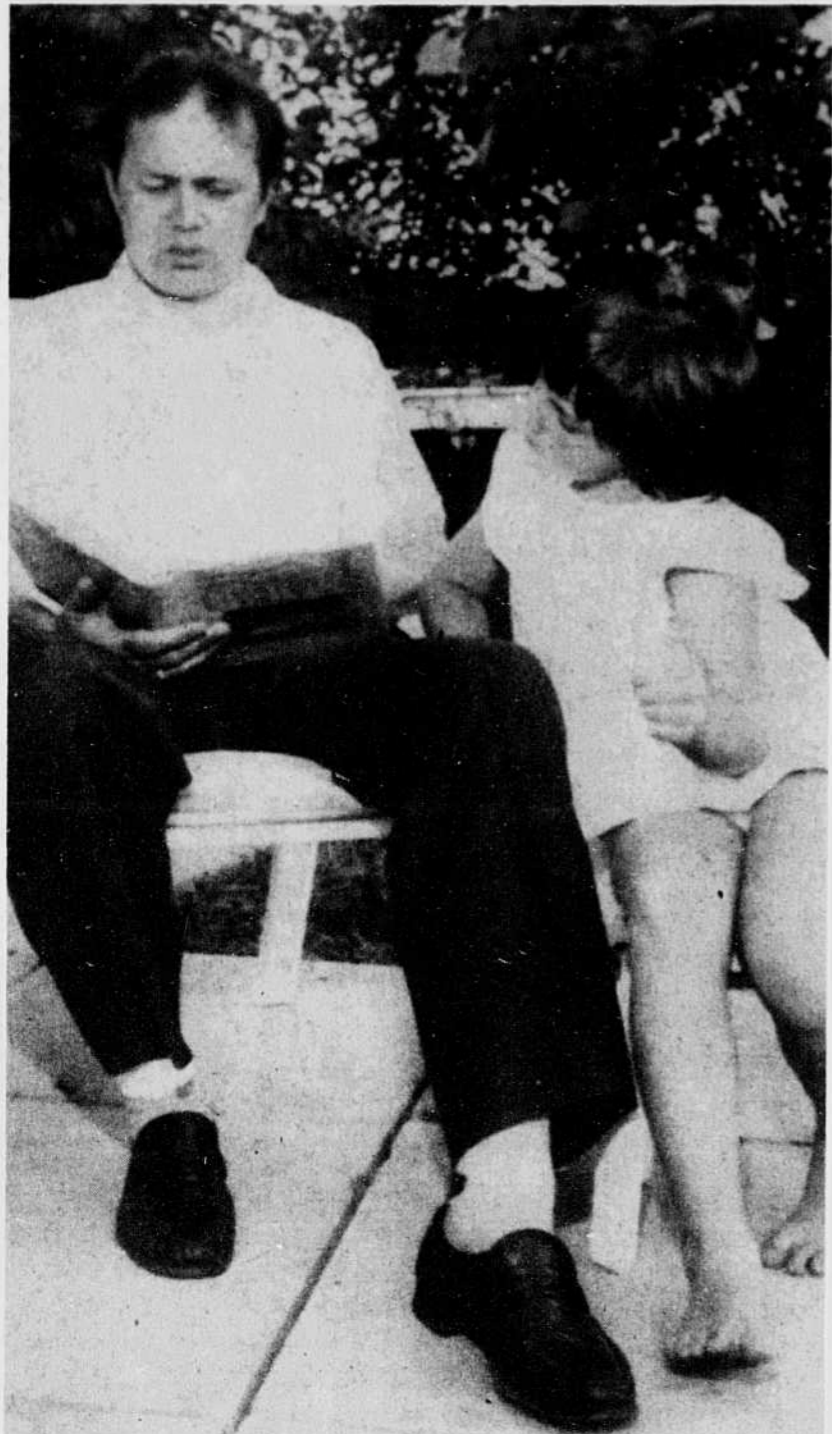
Tout en rapprochant parent et enfant, la lecture à haute voix ouvre à l'enfant un véritable univers de mots et d'idées.