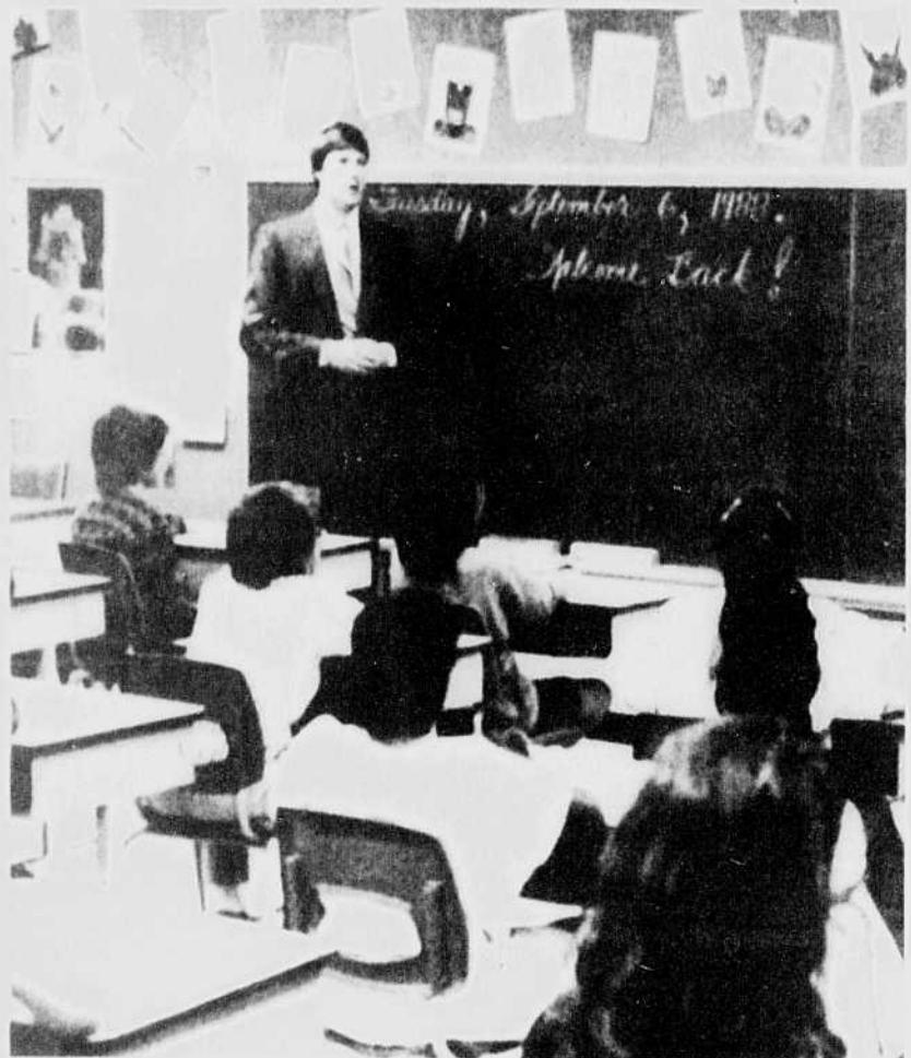
Utilisation d'un matériel didactique approprié, la patience et la compréhension permettent de surmonter la plupart des difficultés d'apprentissage.

"Chaque enfant est différent mais, si un parent s'inquiète, il est préférable qu'il fasse part de ses craintes au professeur et à la direction de l'école. Parfois les autorités scolaires mettent trop de temps à s'occuper du problème. Des parents se sont déjà plaints d'avoir prévenu à trois reprises le professeur que leur enfant ne savait pas compter avant que celui-ci ne réagisse. Les parents devraient toujours faire part au directeur de l'école des difficultés éprouvées par leur enfant; la collaboration du professeur et le progrès de l'élève pourront ainsi être surveillés de près", ajoute-t-il.