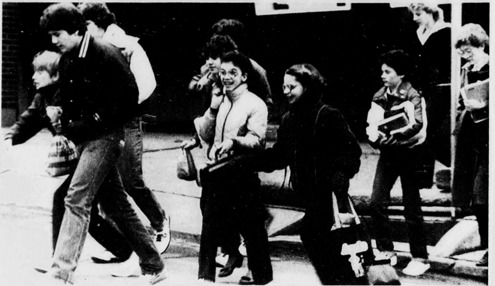
C'est durant les jours qui précèdent immédiatement la rentrée que les parents peuvent généralement dénicher les meilleures aubaines dans les vêtements d'enfants. La concurrence entre magasins n'est pas étrangère à ce phénomène dont profitent les consommateurs.

"Les enfants rejettent souvent les mélanges de laine ou les vêtements de laine 100 pour cent parce qu'ils les trouvent trop chauds ou piquants. Quant aux vêtements 100 pour cent coton, ils perdent leur forme très rapidement lorsque ce sont des enfants qui les portent", ajoute-t-il.