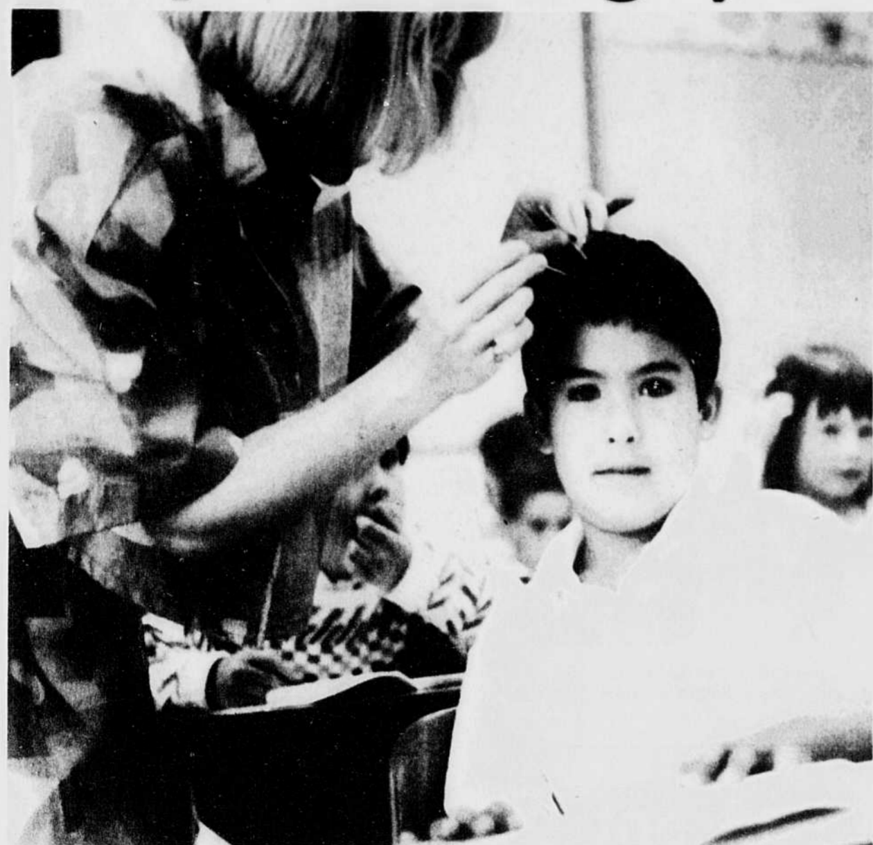
Les poux de tête ont mauvaise réputation mais ils sont inoffensifs bien qu'ils agacent joliment.

par Joanne LESLIE Depuis des années, les responsables de la santé publique se grattent le crâne en cherchant désespérément une solution au problème délicat des épidémies de poux dans les écoles.