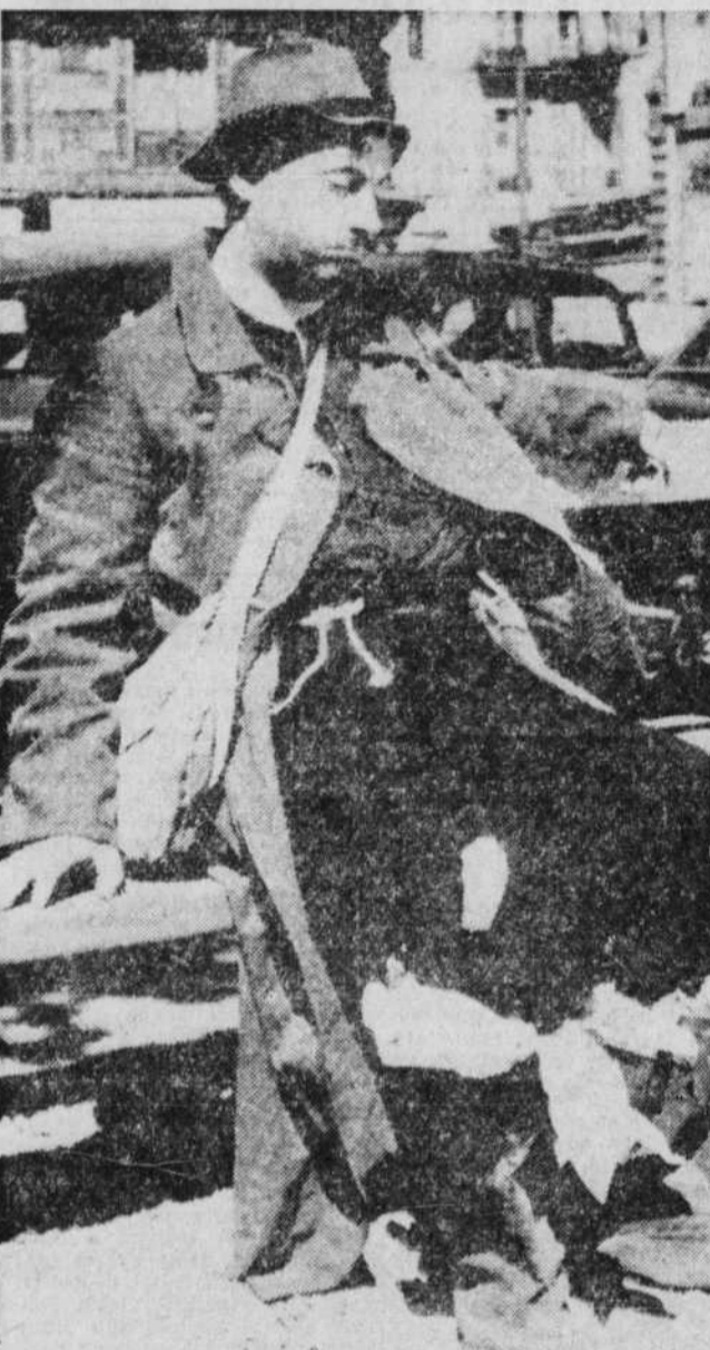
Après le triomphal succès à New-York de leur spectacle "La Plume de ma tante", Robert Dhéry et sa femme, Colette Brosset, ont retrouvé les studios français de cinéma où ils ont commencé à tourner "La Belle Américaine". Dans ce film, MICHEL SERRAULT, que l'on voit ci-dessus, incarnera un savoureux clochard. Également de la distribution du film: Annie Ducaux, de la Comédie-Française; Jacques Fabbri, Jean-Marc Thibault et Louis de Funès.

ALBUQUERQUE — "Expodus" — tous les soirs à 8 h. — matins les mercredi, samedi et dimanche à 11 h. 30. BLISS — "Le rachat du passé" — 12.00 - 3.00 - 5.30 - 8.00. CAPITOL — "Niki" (Walt Disney) — 10.15 - 12.10 - 2.10 - 4.05 - 8.05 - 8.30 - 10.00. CENTRE D'ARTS DE L'ELYSEE — "Une leçon d'amour" et "La recette d'aur" — 8 et 9 p.m. tous les jours — 8 et 9 p.m. le dimanche — VI. 2-6033. COMEDIE CANADIENNE — "Ascenseur pour l'échafaud" — 8.30 — "Bobosse" — 7.00 - 10.00. IMPERIAL — "Aventures des Mers du Sud" — Tous les soirs à 8 h. 40; le dimanche soir à 7 h. 30; matins les mercredi, samedi et dimanche à 2 h. — 8.30 - 10.00. L'ESTEREL — "Le Cuirasse Potemkine" — tous les soirs à 9 h. p.m. — samedi et dimanche à 8 h. et 10 h. p.m. LOEWS — "Francis of Assisi" — 8.30 - 12.30 - 3.00 - 5.10 - 7.20 - 9.30. PLAZA — "Mitsou" — 12.00 - 2.50 - 8.25 - 10.00 — "Le servante du maître" — 12.50 - 4.25 - 8.00. ST-DENIS — "Le rachat du passé" — 12.00 - 3.05 - 5.30 - 8.05 — "Les femmes disparaissent" — 1.20 - 4.25 - 7.10 - 10.15.