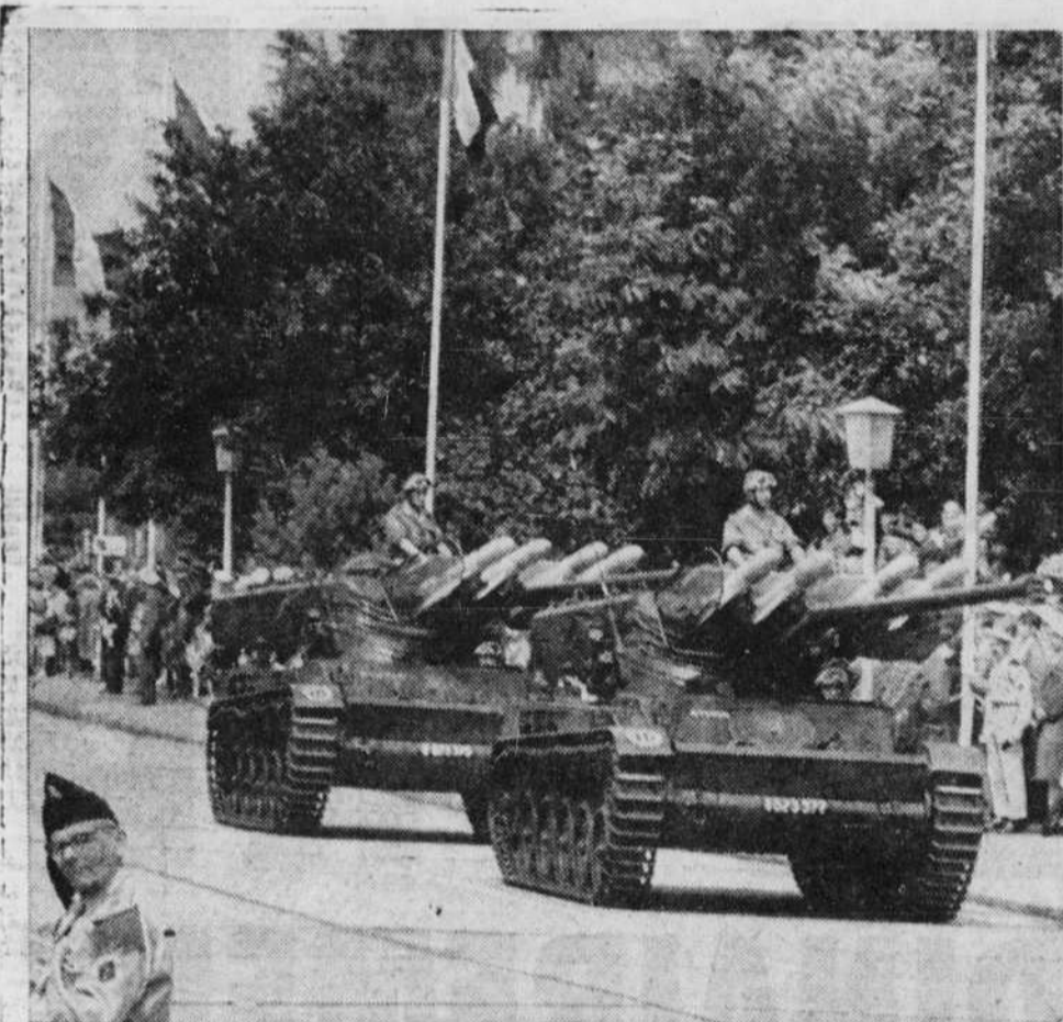
Grande base militaire française, Bizerte se trouve de ce fait incluse dans le dispositif général de défense de l'Alliance atlantique. La présente crise de Berlin rappelle qu'en cas de guerre, Bizerte pourrait jouer en Méditerranée un rôle considérable. Ci-haut, dans le secteur français de Berlin, des tanks munis d'engins téléguidés de fabrication française, prennent part au défilé du 14 juillet.

A Paris, cependant qu'un porte-parole du gouvernement répétait que la France ne négocierait assurément pas sous la menace et la violence, le premier ministre Michel Debré convoquait le chef d'état-major de la défense nationale, le général Jean Olié, pour participer à une réunion restreinte du cabinet avec le ministre des armées, M. Messmer, le ministre des affaires étrangères, M. Couve de Murville, et les titulaires des ministères-clés.