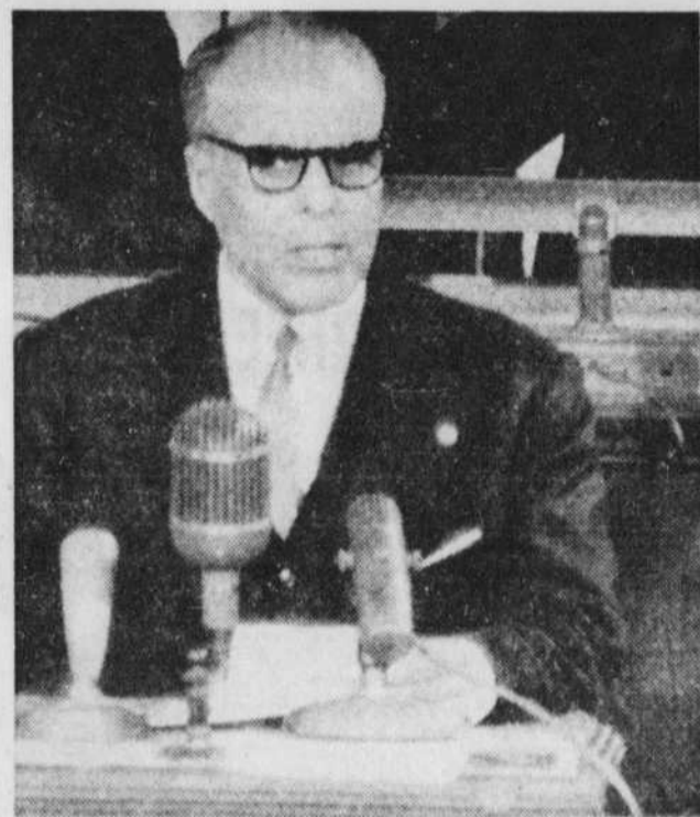
Bourguiba: évacuation totale ou guerre

Par Pierre Laporte (Lire en page quatre)