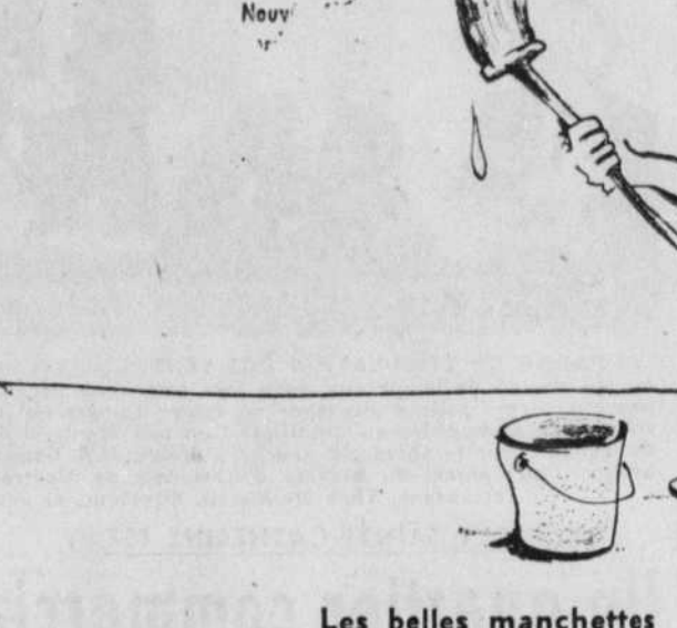
Les belles manchettes

OTTAWA, (P.C.) — L'enquête fédérale sur les effets du bruit sera chargée d'une mission de recherche sur les effets du bruit sur la santé humaine.