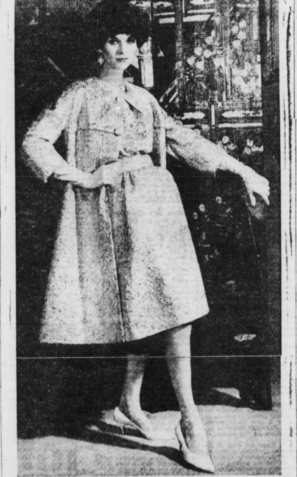
Tissu royal pour les grands soirs: un ensemble en brocard d'or, de Ceil Chapman, tiré de sa collection automne-hiver, présentée à New-York ces jours derniers. Le manteau n'a que deux boutons assez importants, à l'encolure et à l'empieusement du corsage. La robe sans manches est très cintrée et le corsage vaguement blousant est complété par un collier de pierres sombres, par Carnegie. Les gants sont de la maison Aris et les souliers de chez Delman.

boîtes de fer-blanc ou autres articles qui renferment de l'eau ainsi que les petits bassins de jardins qu'il faut nettoyer et faire sécher avant de les remplir.