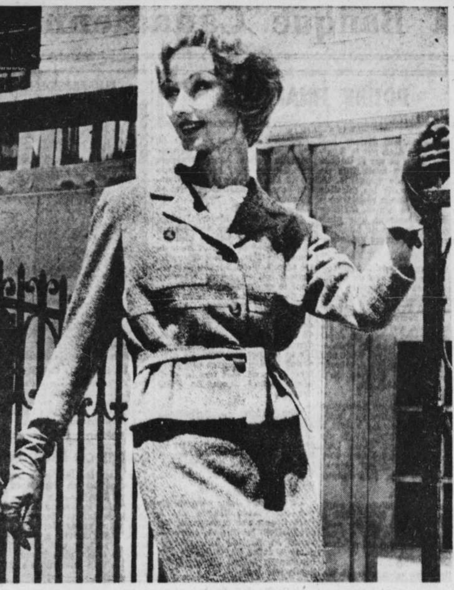
Davidow, de New-York, présente, dans ses collections automne-hiver 1961, ce ravissant costume de tweed gris Linton avec jupe droite et ceinture souple à boucler à volonté.

A la mort de saint Ignace en 1556, il y avait 150 jésuites missionnaires. Actuellement sur les 35,000 membres que compte la Compagnie, 6,400 sont à l'œuvre dans les pays de mission.