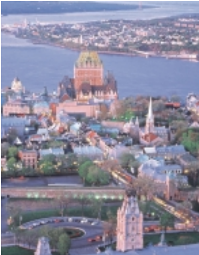
Cidade de Quebec