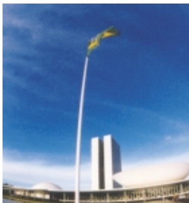
CONGRESSO NACIONAL DO BRASIL