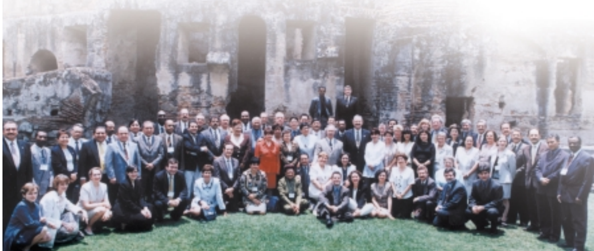
Reunião do Comitê Diretor da COPA em La Antigua, Guatemala, 6 a 9 de maio de 1999