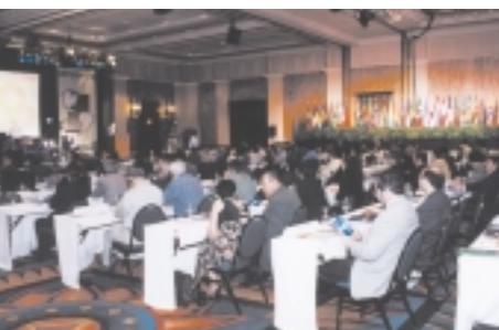
SENADO DE PORTO RICO

A Assembléia teve como tema principal “Construir uma comunidade das Américas justa e próspera”. Um dos desafios enfrentados foi o debate de como superar a pobreza nos nossos países. Uma das grandes preocupações dos participantes foi a criação da ALCA e seu impacto na