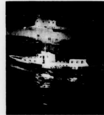
Nous connaissons de nouvelles aventures policières avec «Police du Port», à 19 heures.