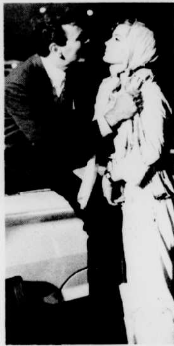
«Prête-moi ton mari», aux «Grands Films», jeudi 27 à 20 h 00.