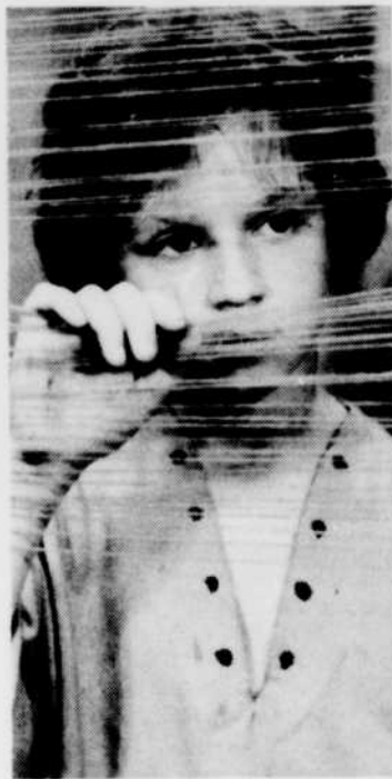
«La Pantoufle dorée», à «Ciné-jeunesse», samedi 22 à 11 h 00.