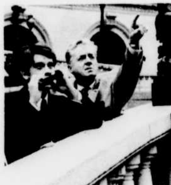
Claude DAUPHIN et Michel BENEDETTI sont les vedettes de «Malican, père et fils», le mercredi à 13 heures.

4e épisode. Jour d'élection au village. Le numéro 6, qui s'est présenté devant l'électorat, accède au poste du numéro 2. Il entend bien libérer tous les prisonniers du village, mais il est encore une fois maté par l'Organisation. 00 h 40—CBFT—TÉLÉJOURNAL