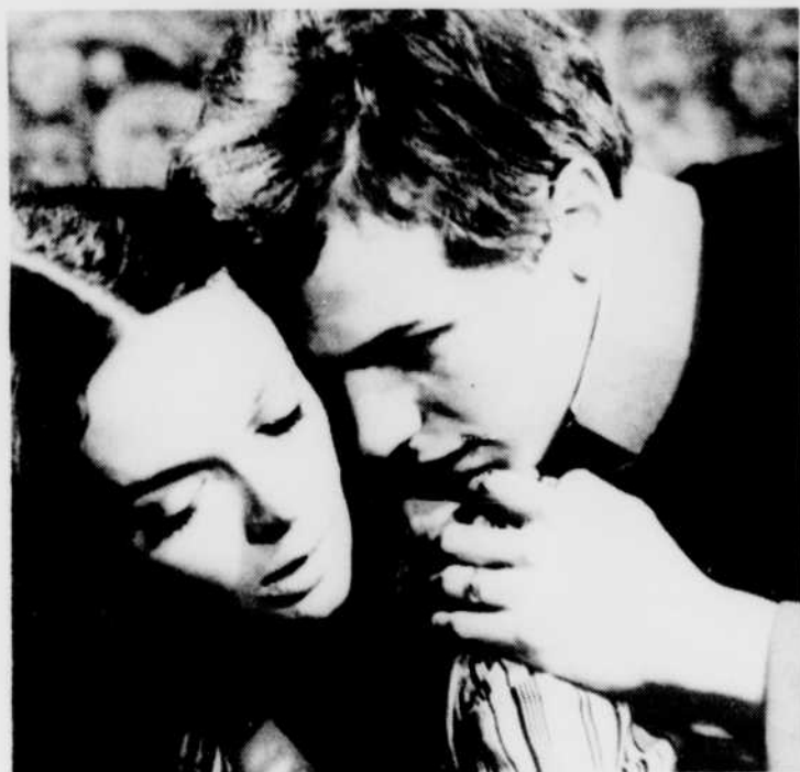
«Les désarrois de l'élève Törless», à l'émission «Ciné-nuit», vendredi 22 vers 1 h 20.