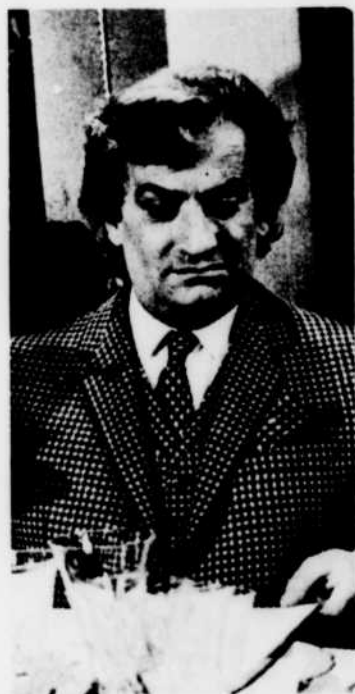
«Le Grand Restaurant», aux «Grandes Comédies», dimanche 23 à 14 h 30.