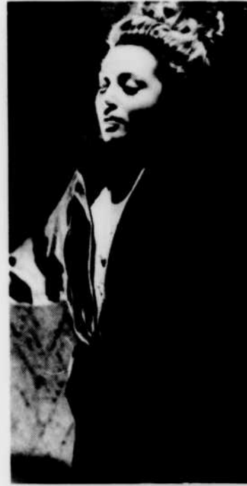
«Ainsi finit la nuit», au «Cinéma», dimanche 23 à 11 h 30.