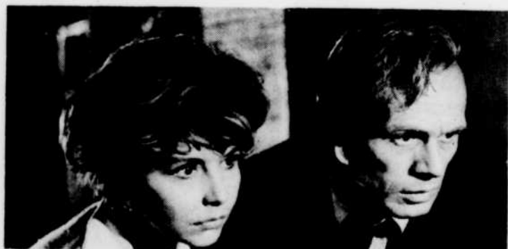
A 23 h 35, «Cinéma» présente «Le Dernier Passage», avec Richard WIDMARK et Sonja ZIEMANN.