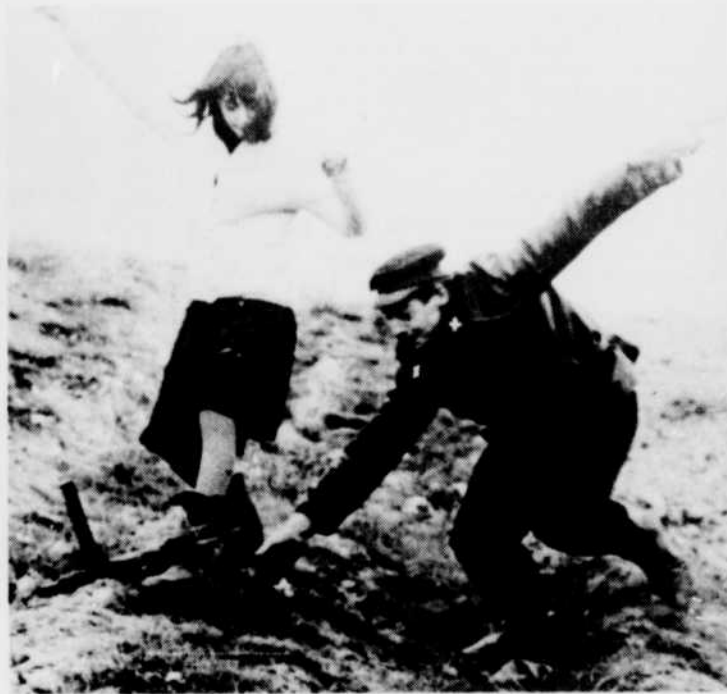
«Les Carabiniers», au «Cinéma», vendredi 28 à 14 h 00.