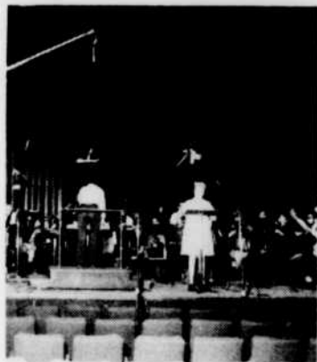
Maureen FORRESTER au Centre national des Arts.