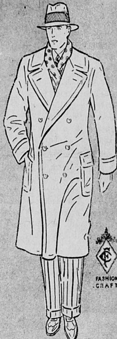
Modèle I 987

Ceux qui ne portent qu'un Ulster Devraient en choisir un BLEU