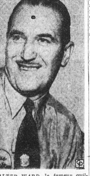
WALTER WARD, le fameux quilleur de Cleveland, qui a fait une tournée des camps militaires des Etats-Unis, a trouvé moyen de prendre part au tournoi national tout-étoiles tenu à Chicago, et il s'est placé en tête de tous les concurrents avec un total de 2339 pour 12 parties, ou une moyenne de 210.