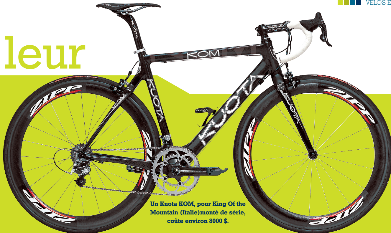
Un Kuota KOM, pour King Of the Mountain (Italie) monté de série, coûte environ 8000 $.