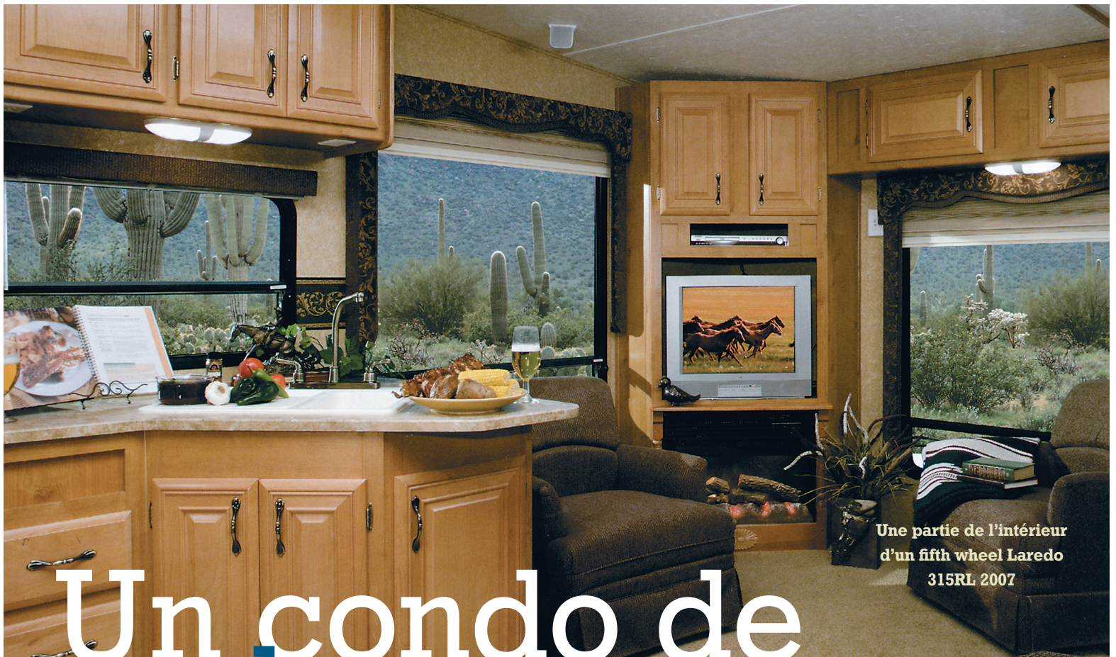
Une partie de l'intérieur d'un fifth wheel Laredo 315RL 2007