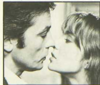
Pour la peau d'un flic

Il y a là un récit mouvementé et des exploits de cascadeurs sensationnels, à travers une sorte d'humour sardonique dans le ton, qui en font un film passionnant.