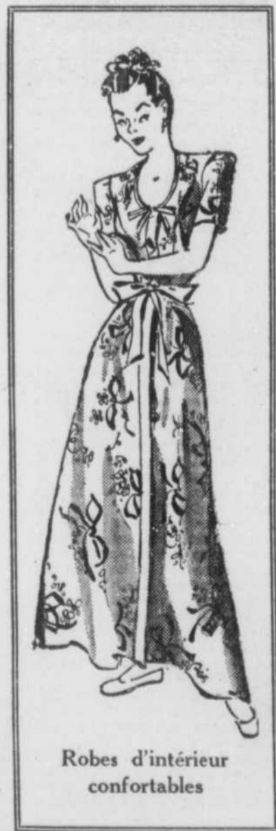
Robes d'intérieur confortables