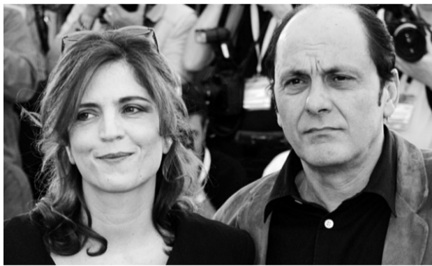
Agnès Jaoui et Jean-Pierre Bacri.

Appelé à commenter une scène de Comme une image , dans laquelle est parodiée l'émission Tout le monde en parle , Jean-Pierre Bacri, qui a écrit le scénario avec sa compagne, la réalisatrice et comédienne Agnès Jaoui, précise qu'il ne s'agissait pas de s'en prendre directement au show de Thierry Ardisson mais de dénoncer toutes ces émissions dans lesquelles les invités sont souvent amenés à se ridiculiser. « Je ne dirais même pas que c'est de la méchanceté parce que ce serait trop flatteur! C'est plutôt toute cette complaisance et ce racolage qu'il nous importait de montrer », a-t-il dit. Quant à ce choix d'avoir donné à la jeune fille du film le prénom de Lolita, Bacri le justifie en évoquant l'immaturité de son personnage. « Il s'agit, typiquement, d'un rêve d'imbécile qui donne à son enfant un prénom qui le titille, tout comme le font ces parents qui prénomment leur enfant Kevin ou Matthew en pensant à des personnages de feuilletons. En l'appelant Lolita, je présume qu'il éprouvait une certaine fierté à l'idée que sa fille soit bonne à niquer dès l'âge de 15 ans! »