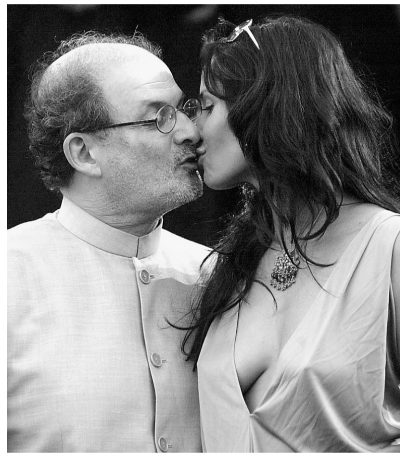
Salman Rushdie et sa nouvelle épouse, Padma Lakshmi.

Tous les palaces de la Croisette déploient pour la durée du festival un système de protection et de surveillance impressionnant. Le Majestic — toujours lui — est sans doute le plus exposé, vu sa proximité avec le Palais et le fait que, tous les après-midi, une foule compacte stationne devant son portail. Sachez qu'à l'intérieur de l'hôtel, il y a 10 gardes de sécurité en permanence à chaque étage. Qu'une fine équipe de gars musclés — mais entraînés à la politesse — est prête à tout moment à intervenir contre des agités, ou une bande de jeunes qui tentent de pénétrer dans la fête qui se donne sur la plage de l'hôtel. « S'ils sont deux, nous y allons à quatre. S'ils sont 20, nous y allons à 20. » Le comble du raffinement : une quarantaine de caméras numériques actionnées depuis une salle de contrôle et qui, une fois « accrochées » à un visiteur suspect, répertorient son identité visuelle et peuvent le suivre dans ses déambulations. Une petite idée pour un scénario.