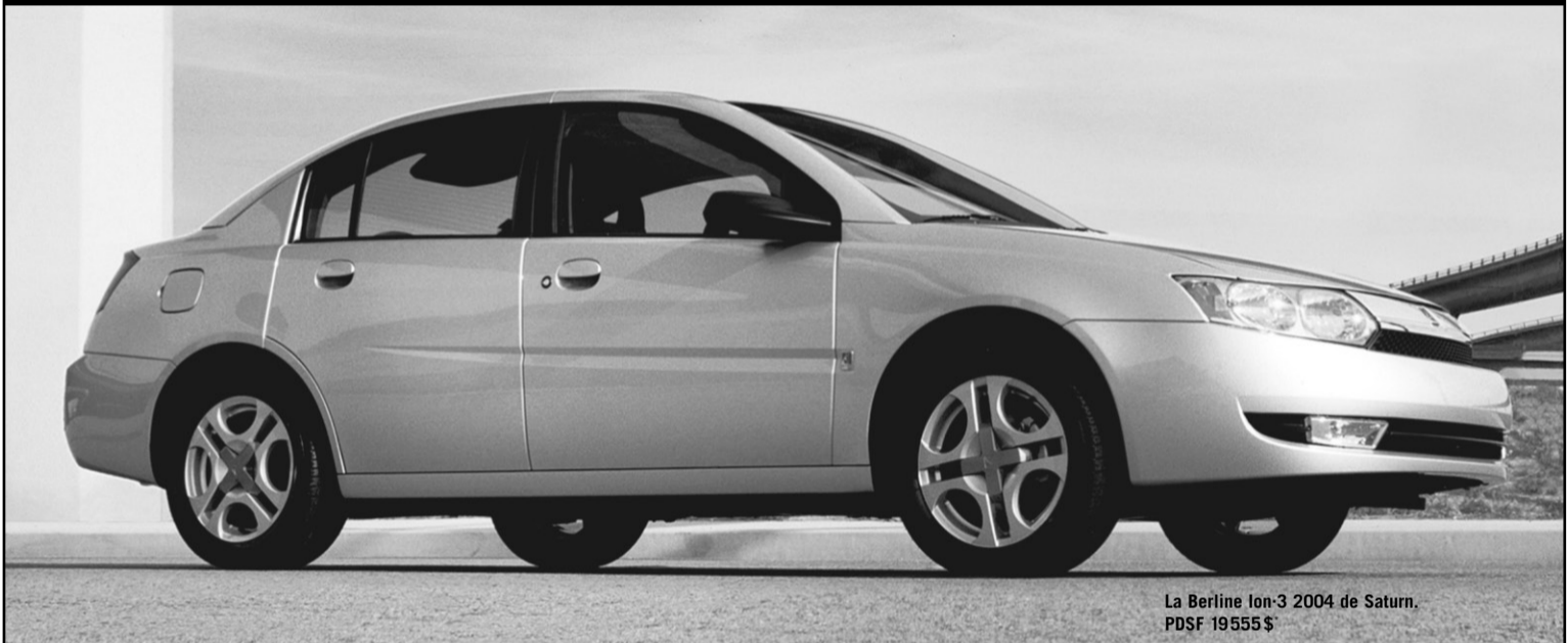
La Berline Ion-3 2004 de Saturn. PDSF 19555 $

La Ion de Saturn versus la Civic. Plus de puissance. Plus de volume utilitaire. Plus d'espace pour les passagers. À vous de décider.