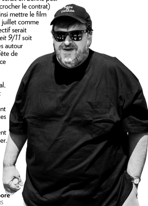
Michael Moore

et pourrait ainsi mettre le film à l'affiche en juillet comme prévu. L'objectif serait que Fahrenheit 9/11 soit dans les salles autour du 4 juillet, fête de l'Indépendance américaine. Rappelons qu'à Montréal, la sortie était prévue le 16 juillet avant que les bonzes de Disney n'interviennent dans le dossier.