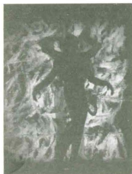
"Il Peccato", 40' x 72'